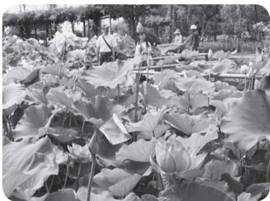
▲品種数は日本一の300種以上

園内では、ハスの茎から地酒が飲める「象鼻杯」の体験や「はす茶」も提供され、真夏の“涼”を感じることができました。