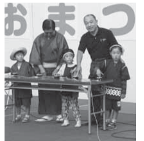
▲黒部川イルミネーション点灯式