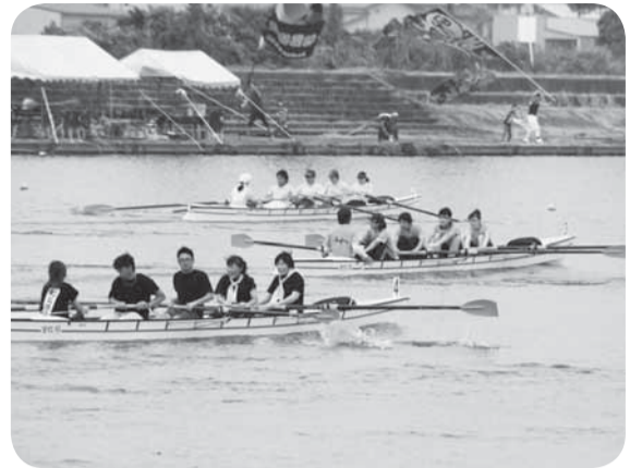
▲息を合わせ、全力で漕ぐ選手たち