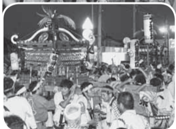
▲大根塚と八日市場の神輿も参加

須賀神社の祭礼である「小見川祇園祭」が行われ、色彩あでやかな6台の屋台が引き廻されました。20日の夜には、大根塚と八日市場の神輿が祇園祭に参加し、お祭りを盛り上げました。おまつり広場前では「の字廻し」や地区合同による「踊りの競演」が行われ、祭りの熱気は最高潮に達しました。