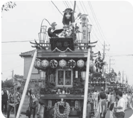
▲香取街道に山車8台が整列