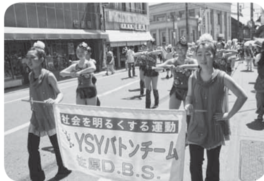
▲YSYバトンチームの華やかな行進

全国的な運動であるこの運動は今年で63回目。佐原中央公民館をスタートした行列は、佐原の町なかをパレードし、非行などの防止を啓発。YSYバトンチームや佐原高校吹奏楽部の皆さんがパレードに華を添えました。