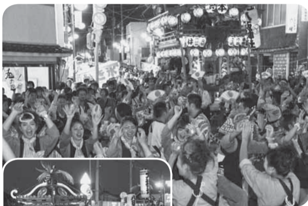
▲おまつり広場前で行われた地区合同の踊りの競演