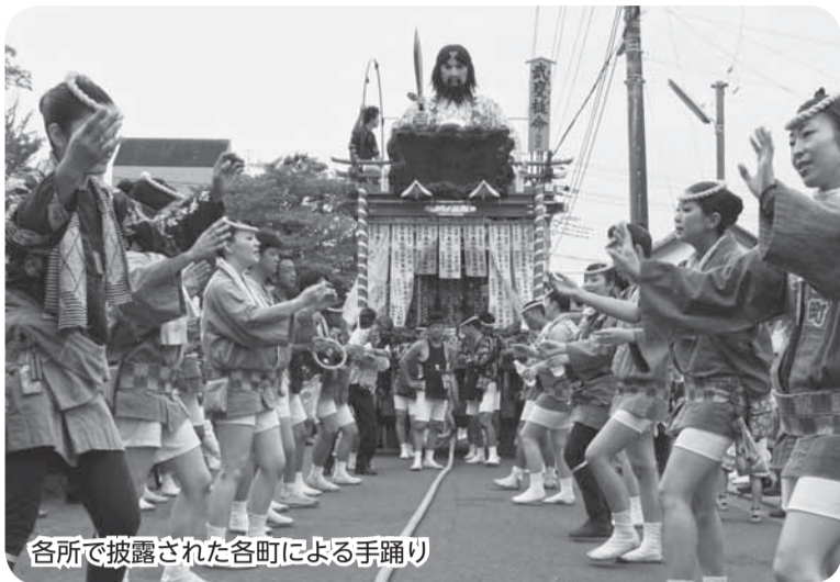
各所で披露された各町による手踊り

13日の夜は、香取街道に山車8台が整列。各町が威勢よく総踊りを行った後、勇壮な「の字廻し」が披露されました。最終日の14日には、下仲町区による熱のこもった神輿渡御も行われました。