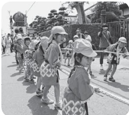
▲園児たちによる元気いっぱいの曳き廻し