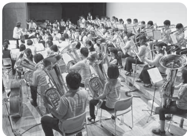
▲合同ステージは迫力が満点

小見川吹奏楽団と山田中学校吹奏楽部出演によるサマーナイトコンサートが、山田公民館で開催されました。それぞれの単独ステージと、合同ステージで構成され、最後に演奏された「たなばた」からは、季節感あふれる夏の夜空の豊かな色彩が感じられました。また、素敵な商品が当たる曲当てクイズや、開演前には縁日も行われ、会場は大いに盛り上がりました。