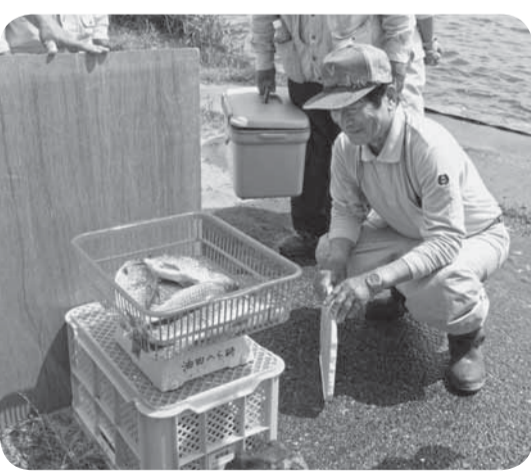
▲良い釣果を期待して計量(水郷おみがわふな釣り大会)

また、水郷おみがわふな釣り大会の競技終了後には参加者へお雑煮が振る舞われました。