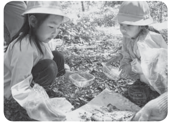
▲園児が自ら容器に移し替え

神道山で行われた幼虫の引き渡しでは、津宮幼稚園の園児が自分の手で直接触れ、容器に移しました。その独特の形と感触に園児は、驚きや不思議そうな表情をのぞかせていました。幼虫は津宮小学校児童にもプレゼントされ、園児・児童は、生きた教材として、成虫になるまで育てていきます。