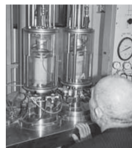
▲試験を確認する委員長

液状化対策検討のための地質調査を市内の50カ所で行っています。現在、現地でのボーリング調査はほぼ完了し、試