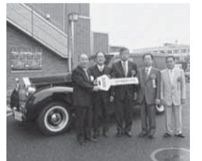
▲日本自動車大学校製作カスタムカー贈呈式