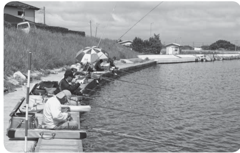
▲佐原のふな釣り大会

ふな釣りのメッカとして知られ、多くの釣り愛好者が集う水郷地帯で、毎年恒例となっている、ふな釣り大会が開催されました。