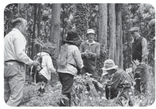
▲牧野の森には種類豊富な植物がたくさん

また、植物観察ガイドが行う解説により、植物のより深い知識を得ることができました。