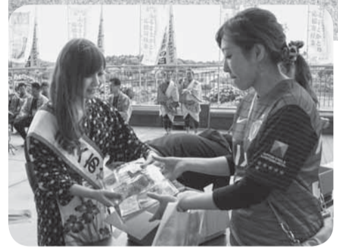
▲ミスあやめによる干しいもの無料配布