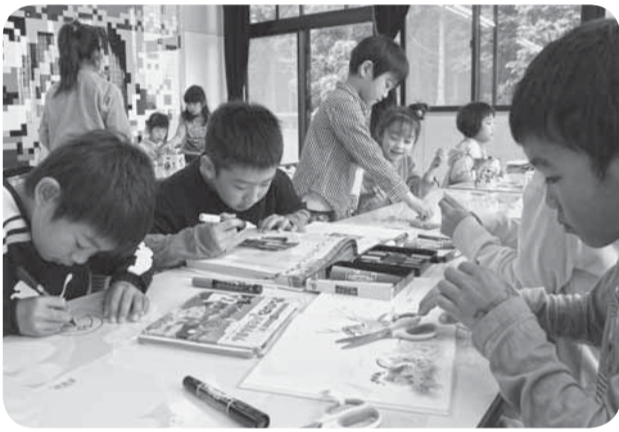
▲プラ板工作に熱中

身近な材料を使った工作を楽しむ「作って遊ぼう教室」が、山田児童館で開催されました。 第1回目の今回は、プラスチック板(プラ板)工作に挑戦。児童たちは、お気に入りのイラストやキャラクターをプラ板にマジックで描き、オーブントースターで焼きました。最後にひもを通し、ビーズなどを飾り付けて完成。オリジナリティーあふれる作品ができました。