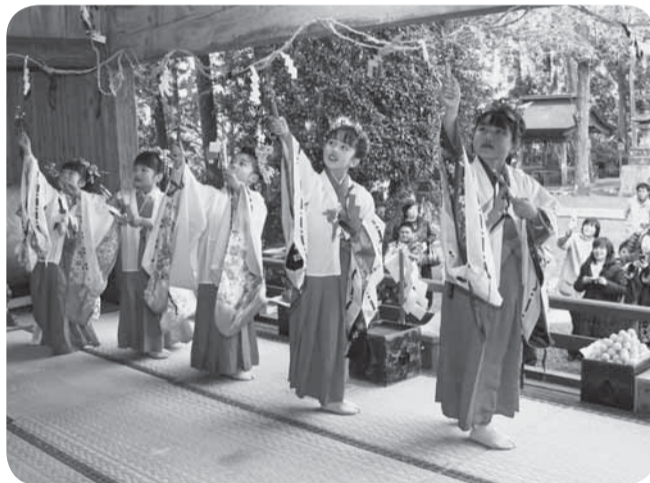
▲かわいい稚児舞 府馬の神楽

同じく市無形民俗文化財に指定されている本矢作伊勢神楽では、剣と鈴を持って舞う「剣の舞」や「鈴の舞」などを奉納しました。本矢作伊勢神楽は、江戸中期に矢作地区に天降神社、天宮神社が造営されたとき、この神楽が奉納されたとされ、同保存会によって復活しました。