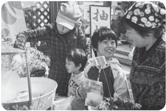
▲できあがりを楽しみな綿あめ作り体験

今年で10周年を迎える、山田地区の交流拠点である風土村で、2日間にわたり大創業祭が開催されました。