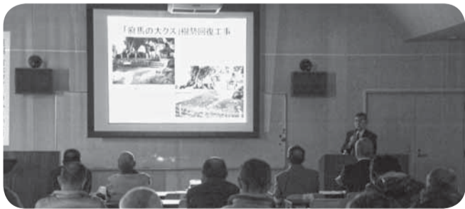
▲多くの参加者が講演に耳を傾けました

樹木に関心を持ってもらい、地域の人々の発展や巨樹・古木の共存を目的とした「巨樹・古木フォーラムinかとり」が、山田公民館で開催されました。このフォーラムは、2006年に第1回目が千葉市で開催されてから今回で7回目。参加者たちは、国の天然記念物である府馬の大クスの保存事例や小見川城山公園の桜再生の講演、パネルディスカッションをとおり、貴重な財産を継承する大切さを学びました。