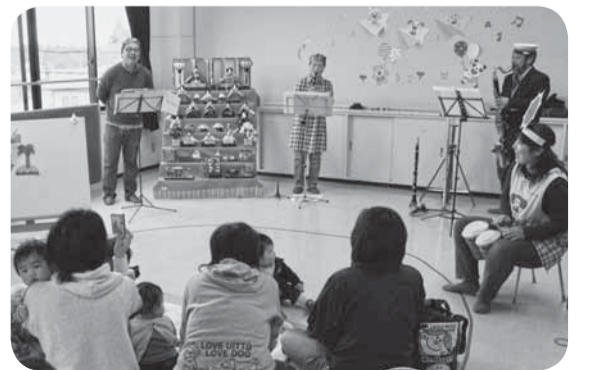
▲演奏だけでなく工夫を凝らした演出も

童謡やアニメの曲の演奏では、太鼓で軽快なリズムを加えたり、ダンスなどを披露するなど演奏を盛り上げました。赤ちゃんたちもタンバリンを握り演奏に参加することも。お母さんたちは木管楽器が織り成す豊かな響きに耳を傾けました。