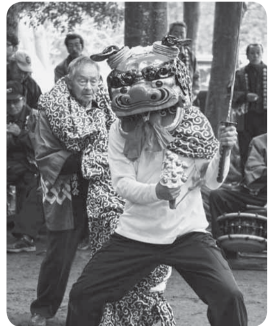
▲勇壮な獅子の舞 本矢作の伊勢神楽