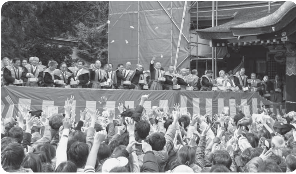
▲年男らによる豆まき（香取神宮）

を福娘が豆をまいて拝殿の外に追い出す儀式などが行われた後、年男女や大相撲の力士らが並び、福豆などをまきました。多くの参拝客は、1年の福を呼び込もうと縁起物の福豆に懸命に手を伸ばしました。