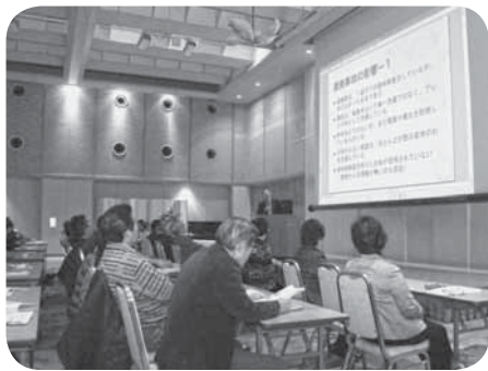
▲講演会では地域の農業の課題などが話されました

講師からは、原発事故の影響や各産地の現状、TPPの動向などの話があり、講演会の後も活発な情報交換が行われました。