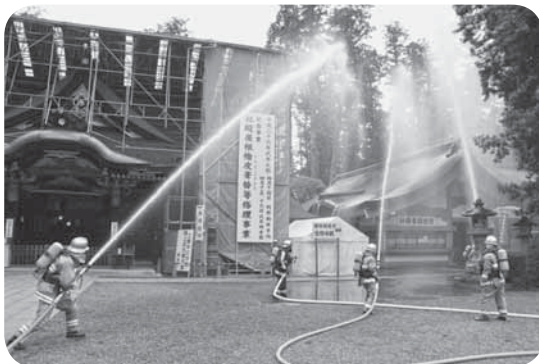
▲貴重な文化財を守るため一斉に放水

貴重な文化財を火災から守るため、毎年行われている防火訓練が、文化財防火デー(1月26日)を前に、香取神宮で行われました。