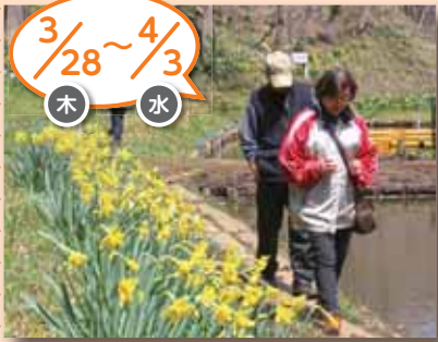
伊能家のおひな様、佐原のおひな様展