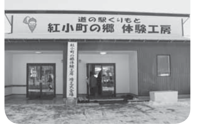
▲オープンした紅小町の郷体験工房

道の駅くりもとに、農産物を活用した加工体験施設が完成し、竣工式が1月29日に行われました。実習室、研修室、貯蔵庫などがあり、体験教室などを通じて、都市と農村との交流人口の拡大が期待されます。