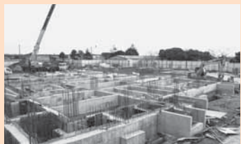
▲新島中学校の新築復旧工事

大規模な被害を受けた学校施設のうち、小見川西小学校は工事が完了し、佐原中学校の災害復旧工事（3月完了予定）および新島中学校の新築復旧工事など（8月完了予定）は、現在施工中です。