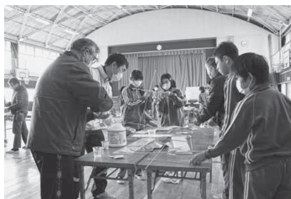
▲交流事業「彦一風作り」(2月8日)

真っ赤な甘酸っぱい実を毎年つける「やまもも」。楽しかったけど、少し悲しかった最後の利北分校との交流会。みんな仲良しで、思い出たくさんの大東分校です。