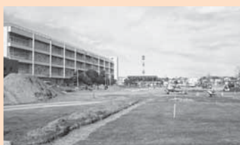
▲佐原中学校グラウンドの復旧工事

市内の小中学校、給食センターは全施設が被災しました。中・小規模の被害を受けた施設は、新島小学校校舎の復旧工事（3月完了予定）を除き、工事が完了しています。