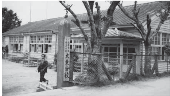
昭和63年2月 現在の場所(附洲新田1356-1)に校舎移転(新校舎)▼