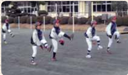
▲練習前のアップは念入りに!!

創立14年目。現在、21人で活動しています。低学年の多いチームですが、少しでも高学年のレベルに近づけるよう、日々練習をしています。野球だけではなく筑波山登山やスキーなどのイベントも盛りだくさんです。