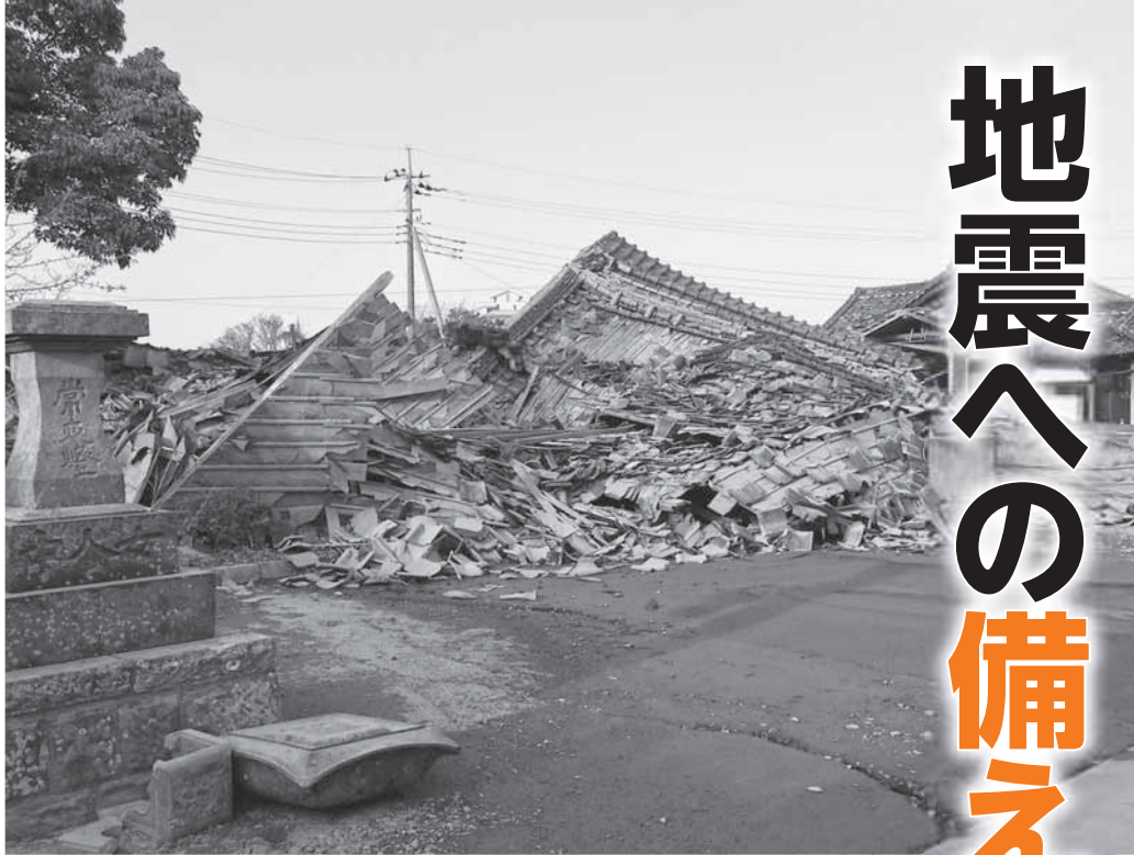
▲東日本大震災により倒壊した長善院（加藤洲）

日本各地で大きな被害をもたらした東日本大震災の発生から、丸2年がたとうとしています。