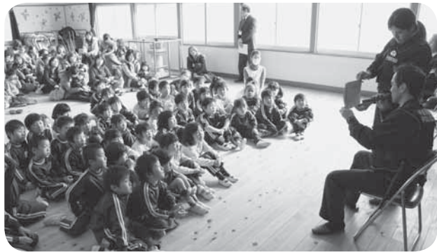
▲紙芝居で防犯の知識を高めました

年長組の園児たちは、講師の警察官の問いかけに元気よく手を挙げ発表。合言葉の「いかのおすし」(「いか」ない…知らない人についていか