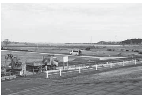
▲利用開始に向け、災害復旧工事が進む佐原河川敷緑地

東日本大震災により、佐原河川敷緑地の利用が中止となっており、利用者の皆さんには、ご不便をおかけしています。