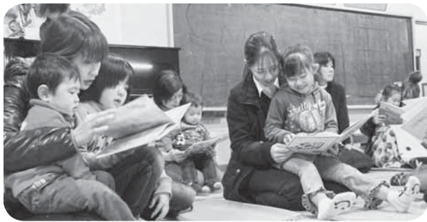
▲読み聞かせは親子のコミュニケーション

白熱した戦いが繰り広げられた会場からは「ファイト～、負けるな～」など大きな声援が送られ、子どもたちは応援を力に変え、精一杯綱を引きました。