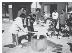
▲地域の人と餅つき大会

野菜収穫祭や校舎での肝試し、イナゴ捕り大会など、楽しかった思い出がいっぱいです。休み時間は毎時間外に出て、全校児童で遊びました。全校で30人弱だったので、2チームに分かれてサッカーをしました。1年生から6年生まで学年関係なく、兄弟姉妹のようでした。そして、先生方は、大勢の中でも活躍できるようにと、一人ひとりを大切に熱心に指導してくださいました。用務員さんも竹とんぼや竹馬を手作りしてくださって、喜んで遊んだのを覚えています。みんなが家族のようアットホームな学校生活でした。