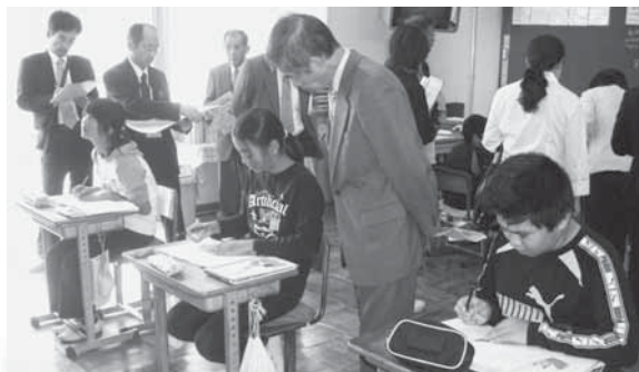
平成25年3月 新島小学校・大東分校統合のため、大東分校閉校