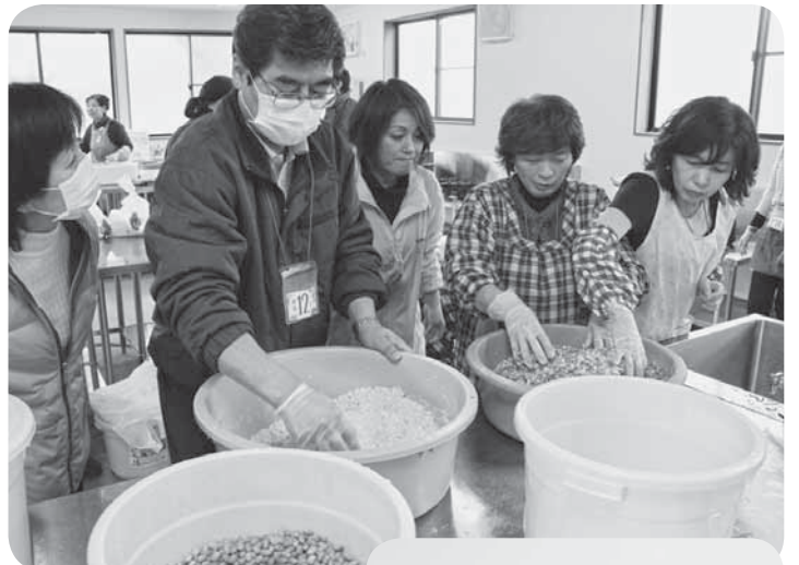
▲心を込めておいしい味噌を手作りします

道の駅くりもとに、農産物を活用した加工体験施設が完成し、竣工式が1月29日に行われました。実習室、研修室、貯蔵庫などがあり、体験教室などを通じて、都市と農村との交流人口の拡大が期待されます。