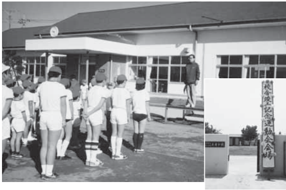
平成18年3月 市町村合併により校名を香取市立新島小学校大東分校に変更