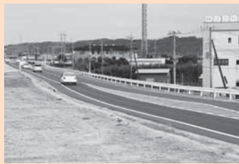
▲本復旧した小見川大橋下流側の利根川右岸堤防沿いの道路

市が管理する道路・河川の被災箇所数は約670カ所で、本復旧済みが約360カ所となりました。佐原・小見川地区の液状化被災地では、上下水道の復旧後、早期に道路などの復旧工事に着手します。