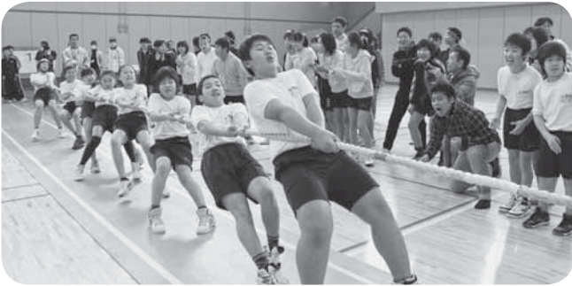
▲多くの声援に力みなぎる