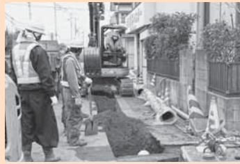
▲配水管、給水管の復旧工事（佐原口）

水道の被災箇所数は33カ所で、本復旧済みが20カ所となり、残りは全て施工中または発注済みです。