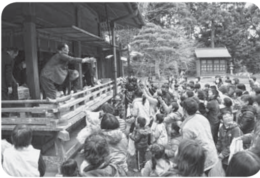
▲福を呼び込もうと手を伸ばす（愛宕神社）

愛宕神社（府馬）では、年男による豆まきが行われ、地元の子どもたちも福を求めて大集合。地域ならではの和やかな節分祭が行われました。