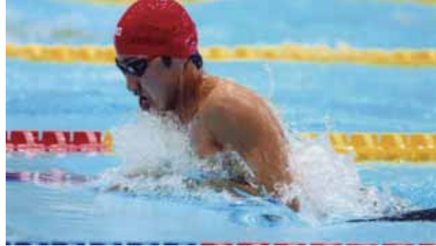
▲全国JOCジュニアオリンピックでの力強い泳ぎ