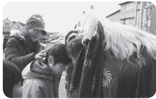
▲獅子舞の登場に頭を差し出す観光客

佐原おかみさん会による「佐原・町並み・お正月」のイベントの一環として、佐原囃子と寿獅子舞が、佐原町並み交流館で披露されました。獅子舞は、竹などのオリジナルお正月飾りで飾りつけされた、商店街の店先や店内を練り歩き、健康と商売繁盛を願い、勇壮な演舞でお正月気分を盛り上げました。