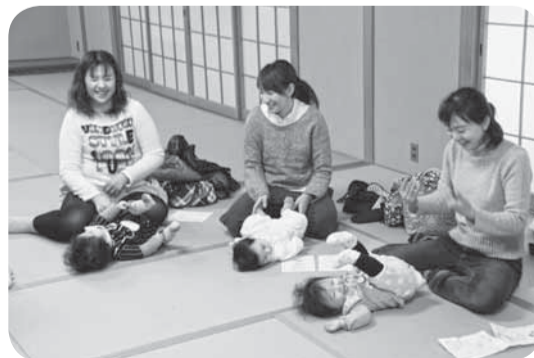
▲楽しいわらべうたに赤ちゃんたちも大喜び

佐原中央図書館による「赤ちゃんを楽しむ絵本とわらべうたの会」が、佐原中央公民館で行われました。