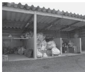
▲佐原清掃事務所ストックヤード

要領「香取市内循環バス広告掲載申込書」は、企画政策課窓口にて設置、または市ホームページに掲載しています http://www.city.katori.jp/ 問い合わせ 企画政策課 ☎(50)1206 ■広告掲載規格・掲載料金