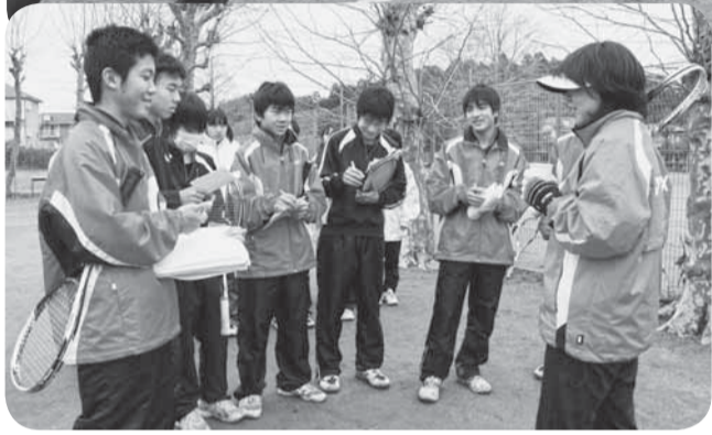
▲講師には多くの質問が寄せられました