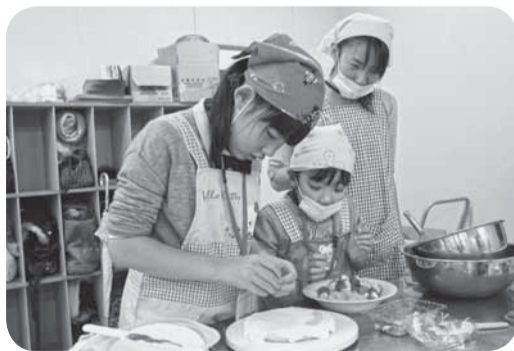
▲色とりどりの果物で飾り付け

今回は、「よちよち歩ける赤ちゃん」のコースと「ねんね、おすわり、はいはいの赤ちゃん」の2つのコース。読み継がれた絵本を楽しみ、親しみやすく歌いやすいわらべうたを歌い、お父さんお母さんは子どもとのコミュニケーションを深めました。