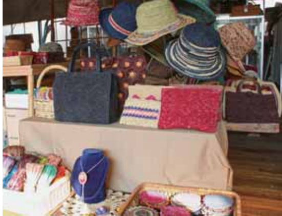
▲佐原ラフィアの作品