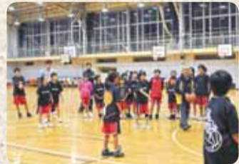
▲心ひとつに基礎を積み上げる