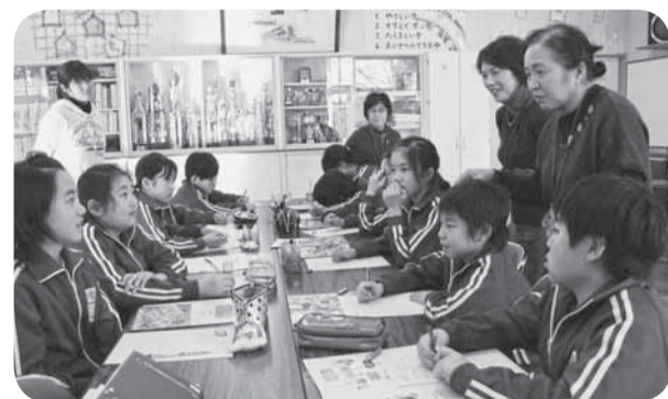
▲認知症の人にどう接したらよいかを話し合う子どもたち

講座終了後には、サポーターの証「オレンジリング」が、民生委員さんから手渡されました。今後、地域で認知症の人や家族の応援者となっていきます。