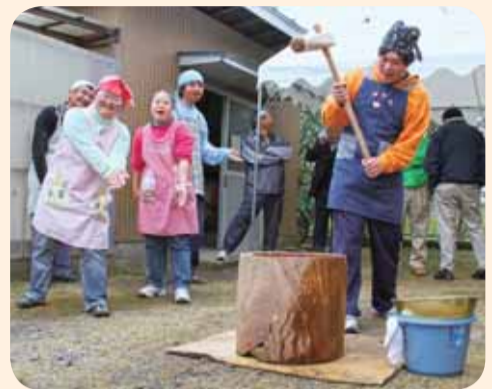
▲熱い声援を受け元気に餅つき(あけぼの園)