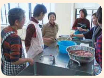
▲どのように染まるのか、待つのも楽しみ

佐原に伝わる香取街道の「美人桜」で世界に1つだけのスカーフ作りに挑戦する、草木染め体験教室が佐原中央公民館で開催されました。 参加者は桜の枝から抽出した染液で煮染めしたあと、ミョウバンを使った媒染液で、色鮮やかにスカーフを染め上げました。