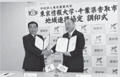
▲11月26日に行われた調印式

市と東京情報大学(千葉市)は、市民協働のまちづくりの推進、大学の教育・研究活動の充実を図るため、11月26日に地域連携協定を締結しました。 大学は、香取市をフィールドとして、持続可能な地域・市民一体型のまちづくりを研究し、市は、情報を専門に学んでいる大学生と市民が交流することで、市をPRするための効果的な情報の発信方法や技術を学ぶとともに、大学の研究成果を地域振興に役立てることができま