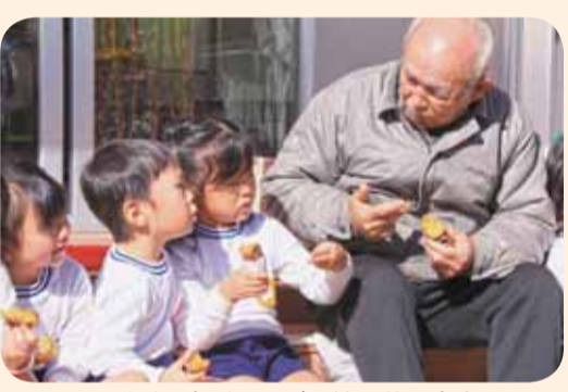
▲手話で会話しながら焼き芋の会食

秋の晴天の下、焼き芋の会が佐原みどり幼稚園で開催されました。 この会には、香取郡市ろうあ協会や地域活動支援センターらいいん香取、聴覚障害者の皆さんなどが招待され、園児たちの元気いっぱいのバトンや鼓笛演奏が披露されました。 演奏後は、お待ちかねの会食。園児たちと招待者は、手話を交えながらホクホクの焼き芋をおいしく食べ、交流を深めました。