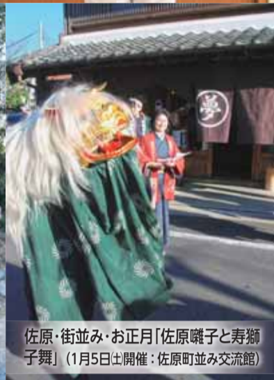
佐原 街並み・お正月「佐原囃子と寿獅子舞」(1月5日開催:佐原町並み交流館)