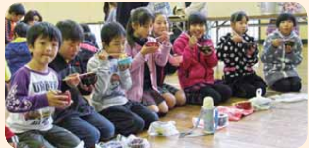
▲つきたてのお餅はおいしいね(香取小学校)