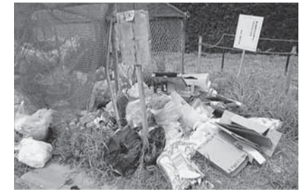
▲不法投棄されたごみステーション

不法投棄とは、「ごみを捨ててはいけない場所にゴミを捨てること」です。 悪質な業者が捨てるものだけが不法投棄となるわけではありません。 例えば、地域のごみステーションは「ごみを収集するまでの集積所」であり、ごみ捨て場ではありません。指定袋に入れなかったり、指定袋以外の袋を使ったりするなど、不適正な状態でごみステーションに置くことも不法投棄となります。 不法投棄をすると 不法投棄した場合、5年以下の懲役、または1000万円(法人には3億円)以下の罰金など、厳しい罰則が設けられています。 市内でも、家庭ごみなどの不法投棄によって、行為者が処罰・指導されています。処罰された中には、1kg未満の家庭ごみを不法投棄したために刑事罰が課せられた事例もあります。 ごみのごみを呼び、さらに荒れて取り返しがつかなくなってしまう前に、みんなで「きれいにゴミを出すこと」を意識してごみの不適正な流れをストップさせましょう。 問い合わせ 環境安全課 ☎(50)1248