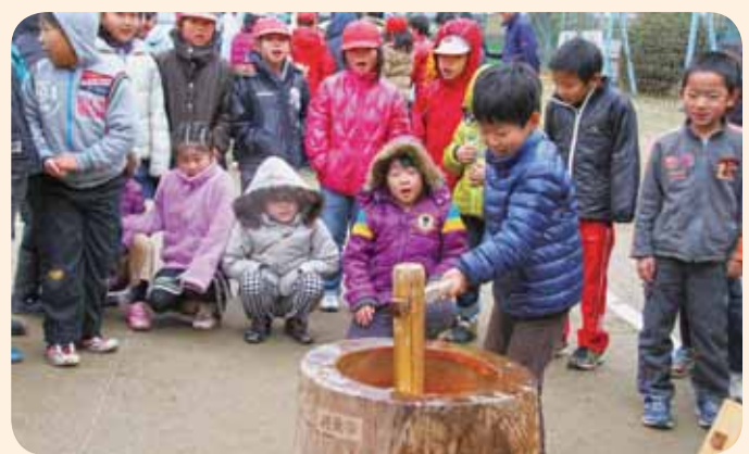
▲「よいしょー、よいしょー」と大きな声で餅をつきました(北佐原小学校)

香取小学校、北佐原小学校餅つき大会 香取小学校、北佐原小学校では、マラソン大会の後、「餅つき大会」が、12月1日に行われました。 香取小学校では、6年生になると餅をつくことができるというのが伝統で、ステータスとなっています。6年生15人は、精一杯力強くきねを振り下ろし、つきたての餅をみんなでおいしく食べました。 北佐原小学校では、低・中・高学年の3つのグループに分かれ、「よいしょ」と大きな声を競い合うように餅をつきました。 参加者たちは、周囲からの声援を受け「べったん、べったん」と、おいしいお餅をつきました。 あけぼの園餅つき会 地域活動支援センターあけぼの園の恒例行事「餅つき会」が、11月30日に開催されました。