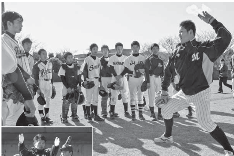
▲熱いまなざしを向ける生徒たち ◀今江選手による打撃指導

香取市には、震災に負けない楽しいイベントや出来事が盛りだくさん。ここでは、そんなホットなまちの話題をご紹介します。