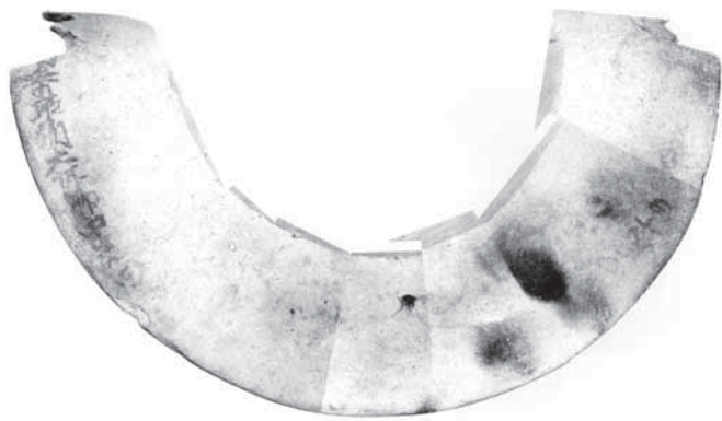
▲「佐原市吉原三王遺跡」発掘調査報告書より