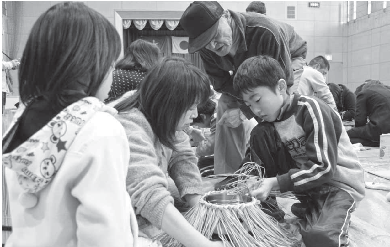
▲手作業で気持ちを込めてわらを編みます ◀親子で協力して門松作りに挑戦