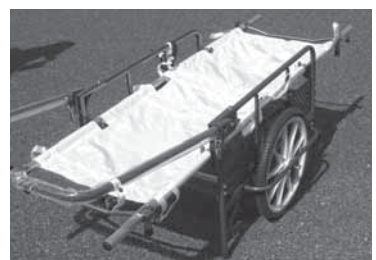
▲貸与される防災用資機材の一例