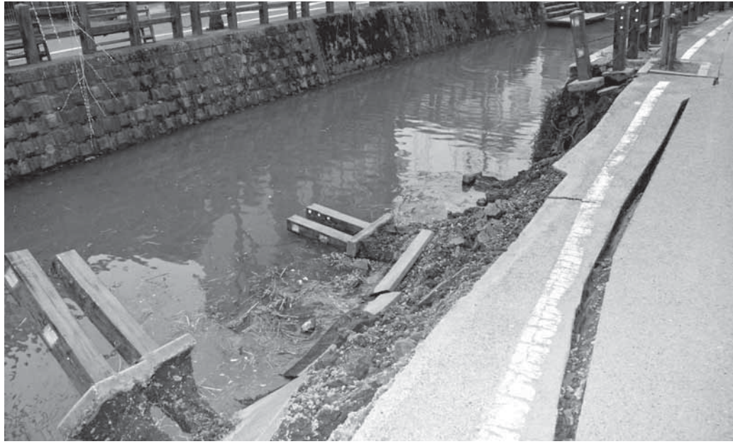
▲東日本大震災で崩れた小野川の護岸