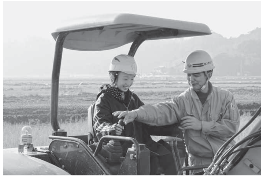
▲バックホウ運転体験

農業機械・建設機械の体験学習が、12月15日に区画整理が進む府馬地区の工事現場で行われました。