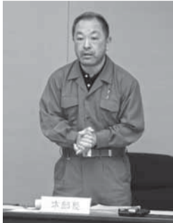
▲災害対策本部会議 (以後、連日開催) (3月11日)