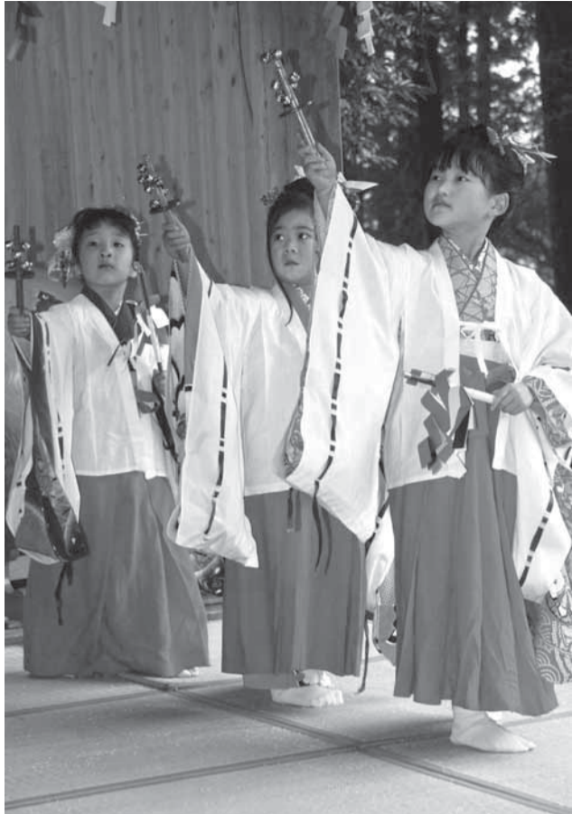
▲かわいい稚児舞 (愛宕神社)