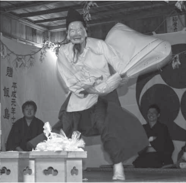
▲鯛投げが行われました (稲葉山神社)

伝統のある神楽の奉納が、五穀豊穡などを願ひ市内各地の神社で行われています。長岡の神楽が2月18日に稲葉山神社で、府馬の神楽が2月25日に愛宕神社で奉納され、十二座神楽の迫力のある演舞で多くの観衆の目をくぎ付けにしました。各地域の神楽の中には、一時期中断されていた神楽もありましたが、地元の有志により復活し現在も継承されています。