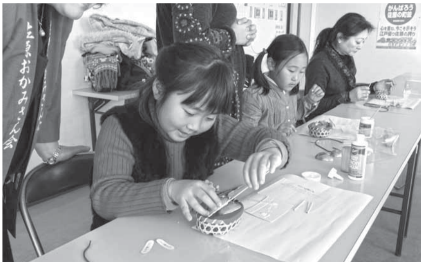
▲桃の花などで自分好みに飾りつけ

佐原おかみさん会によるエッグアートのおひな様教室が、2月18日に佐原町並み交流館で行われ、子どもから大人まで、幅広い年齢の女性たちが参加しました。