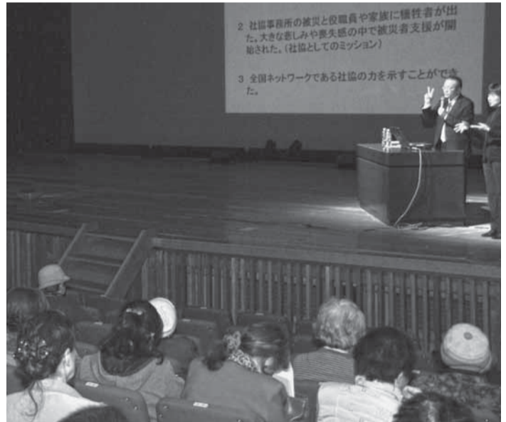
▲「東日本大震災における取り組みについて」の体験発表

多くの福祉関係者が集う「香取市社会福祉大会」が、2月24日に佐原文化会館で開催されました。大会では、長年にわたり香取市の社会福祉の発展に寄与された人を表彰する顕彰式のほか、千葉県社会福祉協議会による「東日本大震災における取り組みについて」の体験発表があり、震災時のボランティア活動や被災地への支援の状況が発表されました。