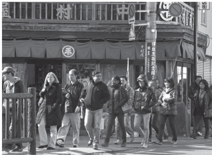
▲約40人の学生たちが来市し、佐原の町並みを見学

卵の殻の柔らかい曲線を生かした、かわいらしいひな人形を、桃の花などで飾りつけ、オリジナルのおひな様を作りました。