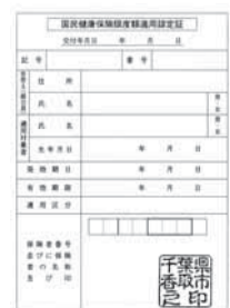
▲限度額適用認定証

70歳未満の人、および70歳以上で住民税非課税世帯の人は、加入する保険者から限度額適用認定証の交付を受けてください。 ●問い合わせ 市民課 ☎(50)1228