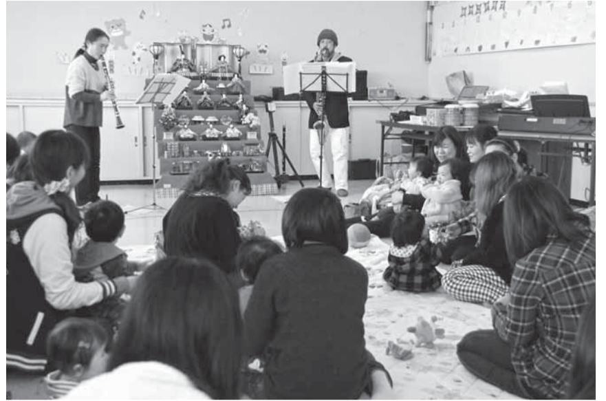
▲愉快で楽しい演奏に赤ちゃんたちもご機嫌

0～1歳の赤ちゃんやさしいクラリネットやフルートの音色を楽しむ「バブちゃんサロン音楽会」が、2月21日に山田公民館で開催されました。