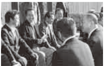
▲菅首相と談笑を交えての意見交換会