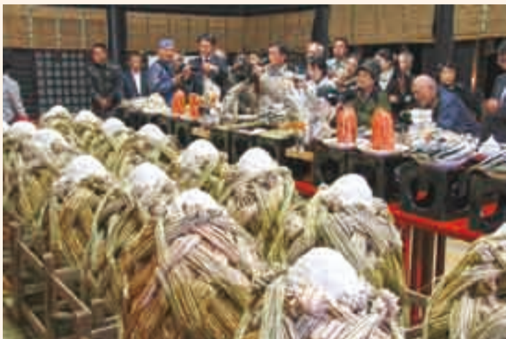
▲全国的にも珍しい祭事「大饗祭」に、大勢の参拝者が訪れました