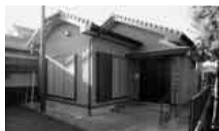
▲完成した仁井宿第三町内会コミュニティセンター

当施設は、地域コミュニティ活動の活性化や、町内会の活動を継承していくための場として活用されます。