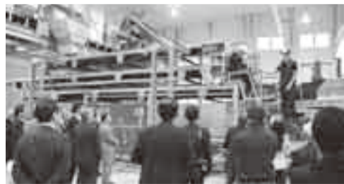
▲菌床をトンネル内へ出し入れする「フィリングカセットコンベア」

これまでオランダから の輸入に頼っていた菌床 を、今回設立された菌床 栽培施設で生産すること で、輸入経費の削減と、 生産量が大幅に増大しま す。