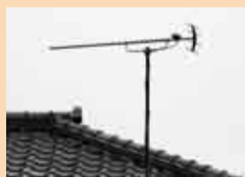
地上デジタル放送を見るにはUHFアンテナが必要です

平成23年7月24日、現在のアナログ放送は終了し、地上デジタル放送に完全移行します。 現在お使いのテレビの