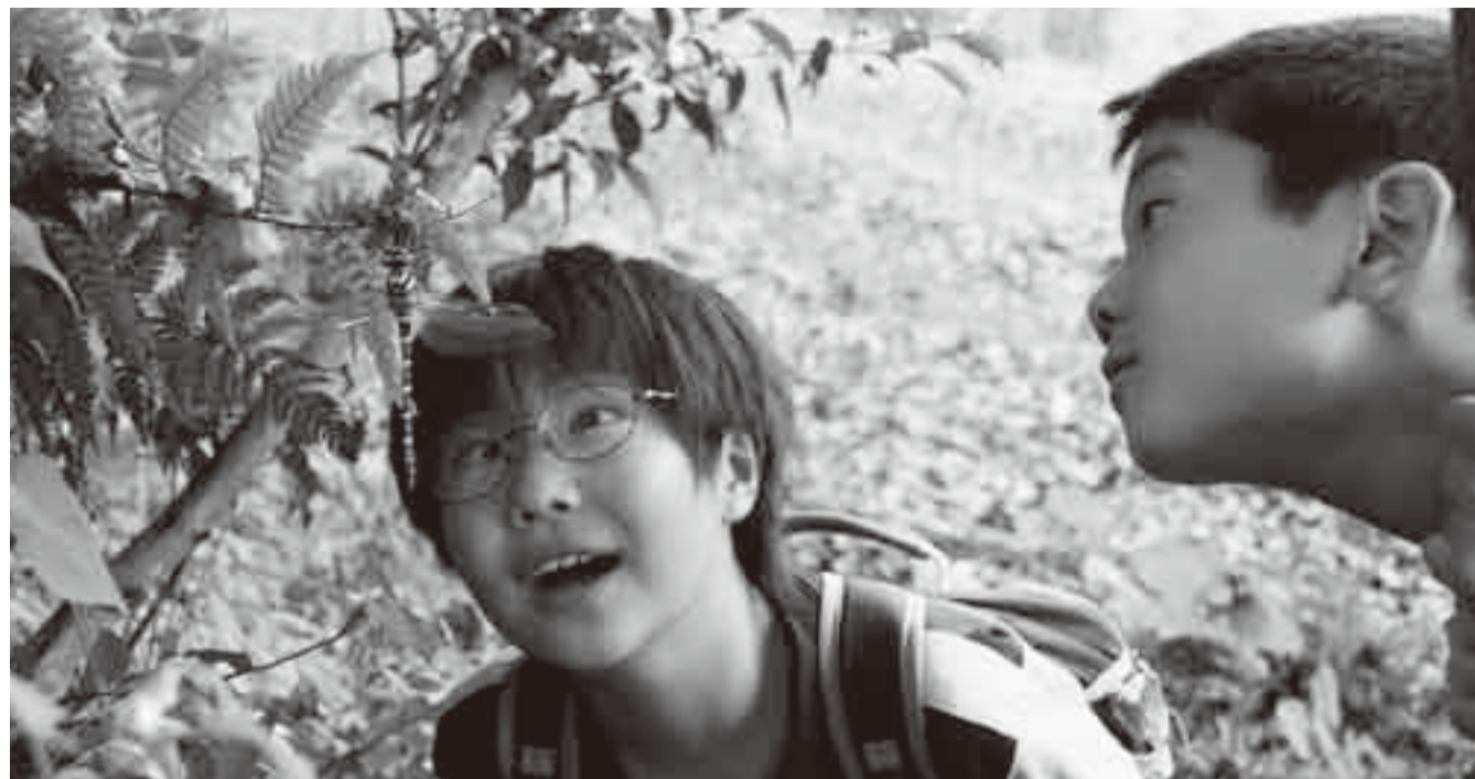
▲羽化したばかりのオニヤンマを見ることができるのも山遊びならではの