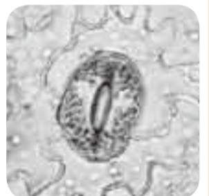
▲表皮細胞の形は種で異なる(写真はベニシダ)