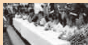
イルミネーション点灯式

黒部川にイルミネーション 7月24日(土)から8月15日(日)まで、子どもたちの願いごとが書かれた約500個のボンボリが点灯します。 ■イルミネーション点灯式 7月24日(土)19時に中央大橋で、小見川幼稚園の園児がボンボリを一齐に点灯させます。 ◇オープニングイベント 16時からおまつり広場で、おみがわよさこい会「和氣謠謠」、マイル本間フラスカール小見川グループ、オミザイルの皆さんがオープニングを盛り上げます。大橋では6町の屋台が手踊りを披露します。 水郷小見川観光協会事務局(小まちづくり課内) ☎(82)11117