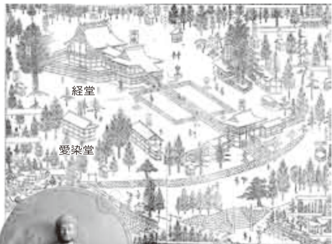
▲江戸後期の香取神宮 (「香取参詣記」より)