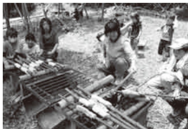
▲焦がさずに上手に焼くにはコツが

県民の日(6月15日)の恒例行事、山田児童館の遊び体験が、山人の森(新里)で行われました。 この日の天気は雨と予想されていましたが、暑い日差しは夏日和となり、参加した子どもたちは、ボランティア集団「山人」の皆さんと、元気がいっぱい自然と楽しく遊びました。 里山散策中には、羽化したばかりのオニヤンマを発見。ヤゴの中から出てきたばかりのオニヤンマをはじめ、めぐる子どもたちは、興味津々に飛び立つまで観察していました。 お昼ご飯は、自分たちで火をおこし、竹に巻きつけたパン生地を火であぶりながら焼いたパンを、梅雨晴れの青空の下でおいしく食べました。