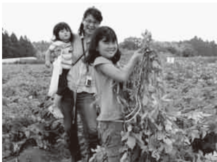
▲ゴロゴロと出てくるじゃがいもにビックリ!

収穫期を迎えた「じゃがいも」づくしのイベント『じゃがいも祭り』が6月12日・13日、道の駅くりもとで行われました。 いもの大きさを競う「じゃがいも掘り大会」には、多くの家族連れが参加し、どんな大物が出てくるかワクワクしながら掘り取り体験をしました。 また、大きなせいろで蒸した、6種類の地元産新じゃがの食べくらべが行われ、旬のじゃがいもで満腹の2日間となりました。 そのほかにも、道の駅くりもとでは宮崎県畜産農家を支援するため、6月30日まで募金活動などが行われました。