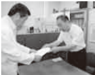
▲県立佐原病院訪問 (6月16日(水))