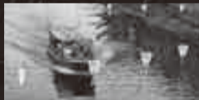
黒部川を走るシャトル船