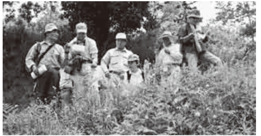
▲植物研究者(左)の分かりやすい解説は参加者からも大好評

身近にある貴重な自然環境の体験を目的として6月13日、牧野の森(橋ふれあい公園隣)で、環境ボランティアと市の協働による「自然観察会」が開催されました。