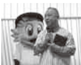
▲千葉ロッテマリーンズ 香取後援会発足式 (1月16日(日))