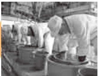
①米を精米し洗米 全員が息を合わせて米を洗い、水に浸し、翌日には米に水が100%含まれた状態にする。天候にも左右されるため、杜氏の長年の動がなせる技である。