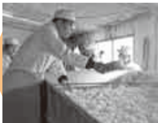
③麹づくり1 酒造りで最も難しいとされる麹づくり。蒸米の一部に麹菌を加える。