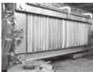
⑥搾り もろみを圧搾し、酒かすを分離して清酒へ。その後、ろ過や火入れ殺菌を行い、貯蔵される。火入れを行わないものは「本生酒」として出荷される。