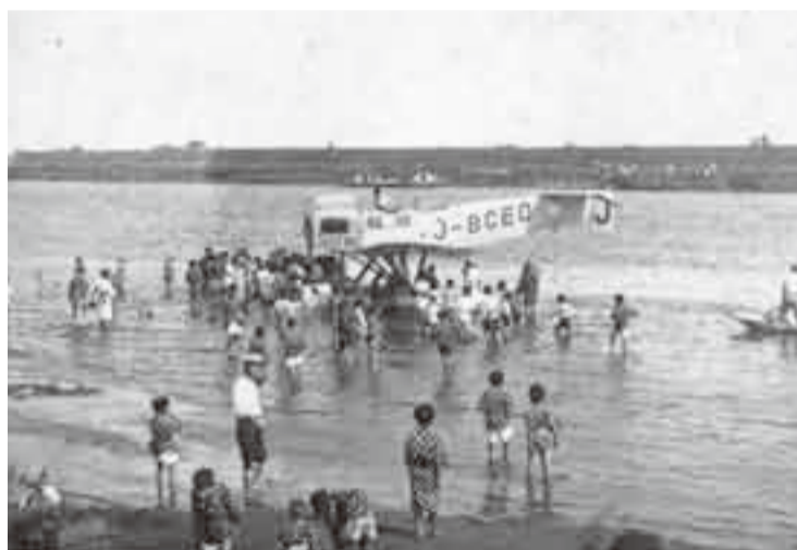
▲映画会社松竹が宣伝用に水上飛行機を特別に飛ばした時のもの

午前9時、銚子河口から水上飛行機が発進離水します。向かうはわが街香取。とうとうと流れる利根川を眼下に見下ろし、右下には水田が朝日に照らされて光り、左側の台地には豊かな森や畑が見え、遠くには筑波山も見えます。次第に与田浦の湖面が見え水郷大橋の手前、小野川河口の利根川中洲付近に着水します。時間にして約15分の水上遊覧飛行の旅です。