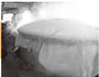
②蒸米作業 前日洗米した米を、まだ日が昇らない早朝から約1時間半をかけて蒸す。蒸米は酒造りの基本。蒸米がうまく造れて、はじめてうまい酒が造れる。