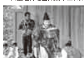
▲山倉大神白川流十二座神楽