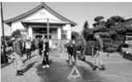
▲善雄寺で行われた訓練

貴重な文化財を火災から守るため、毎年行われている防火訓練が、文化財防火デー(1月26日)を前に1月21日、香取神宮で行われました。 訓練は、香取保育所の園児や近隣住民など多勢の人が見守る中、初期消火活動や貴重な文化財の運び出し訓練、消防署員による消火、負傷者の救出・搬送など、緊迫した訓練となりました。 また、1月23日には、善雄寺(二ノ分目)でも防火訓練が行われ、消防署員の指導による消火器を使った消火訓練など、大切な文化遺産を守るための訓練となりました。