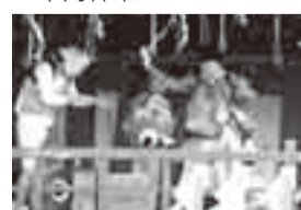
▲八重垣神社白川流十二神楽