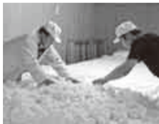
④麹づくり2 一定の温度に保たれた麹室で丸2日間寝かす。麹菌は生き物であるため、目を離せない。