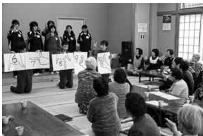
▲生徒たちとの交流を楽しむ高齢者の皆さん

香取市社会福祉協議会小見川中央地区社協による、1人暮らしの高齢者の集いが小見川社会福祉センターで行われています。普段1人である機会の多い高齢者の皆さんは、にぎやかで会話も弾むこの集いを楽しみにしています。