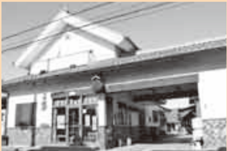
馬場本店 (佐原イ) 天和年間(1681~1683)創業。 大吟醸「海舟散人」は全国新酒鑑評会金賞受賞。「最上白味麴」も大好評。 ☎(52)2227