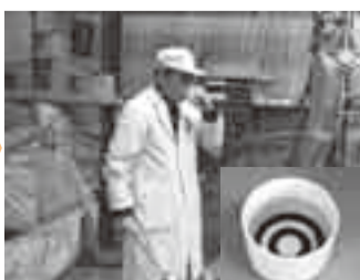
⑦初呑切り 青い線の入った猪口に酒を入れ、色、にごりを見る。そして香り、味、最後に含み香を確かめ、出荷の時を待つ。