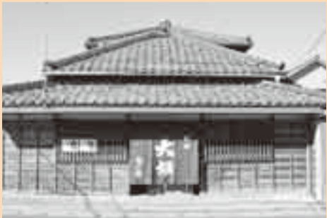
飯田本家 (小見川) 明治10年(1877)創業。 最近では、2代目当主の名前を付けた吟醸辛口「惣兵衛」が人気。 ☎(82)2037