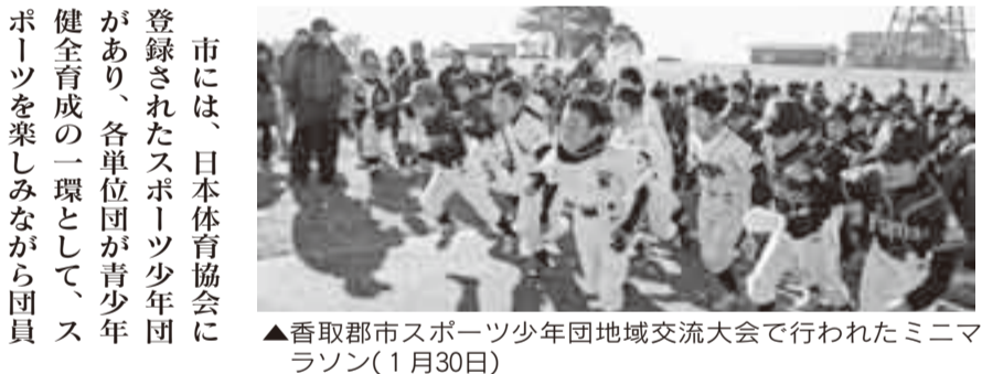
▲香取郡市スポーツ少年団地域交流大会で行われたミニマラソン(1月30日)

市には、日本体育協会に登録されたスポーツ少年団があり、各単位団が青少年スポーツを楽しむながら団員相互の調和と親睦を図ることを目的に活発な活動を行っています。