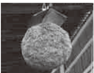
⑧新酒完成・杉玉 店先に、新酒の完成を知らせる青々とした杉の玉が掛かる。これは杉玉(酒林)と呼ばれ、新酒ができると新しいものへ掛け替えられる。