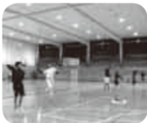
▲夢に向かってスマッシュ!

小見川高校バド部(2年男子15人、女子5人、1年男子8人、女子2人)の念願は、次の総合体育大会ブロック予選会を勝ち抜き、県大会に出場すること!昨年秋の新人戦でのくやしさをばねに、仲間どうし互いに励まし合いながら、ランニング、階段走り、ノックなどの練習を毎日頑張っています。小見高バド部、ファイト!