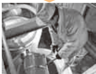
⑤もろみ仕込み 3段仕込みと呼ばれ「添」1日休ませる「踊り」「仲」「留」と4日間かけ、醗(酵母)が入ったタンクへ、3度に分けて蒸米、麹、水を加え、アルコール発酵させる。