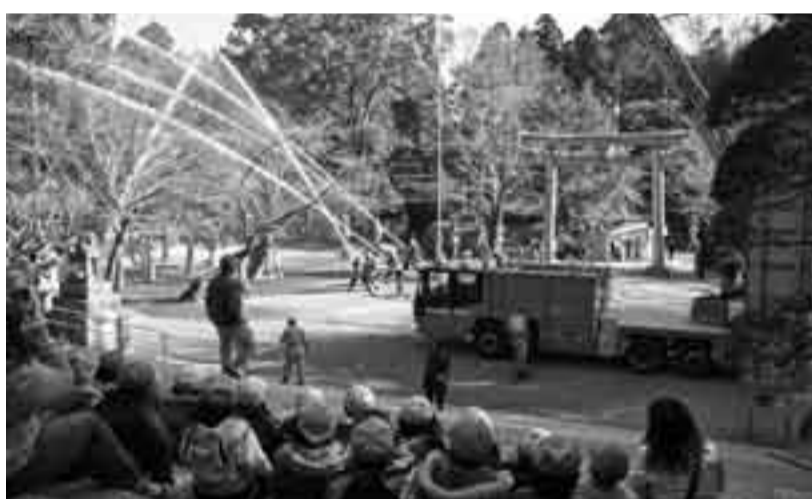
▲見学に訪れた保育所園児が見守る中に行われた香取神宮の防火訓練

1月15日は小見川中学校の体験ボランティア学習の一環として、生徒たちとの交流会が行われました。生徒が作ったお弁当や催しなどを楽しみ、笑顔がたえない集いとなりました。