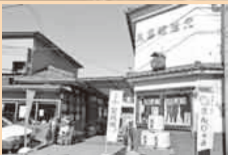
東薫酒造 (佐原イ) 文政8年(1825)創業。 大吟醸「叶」は全国新酒鑑評会11回金賞受賞のほか、さまざまな賞を受賞。 ☎(55)1122

酒蔵を訪ねる 市内3カ所にある酒蔵すべてで、酒蔵見学を行っています。見学を希望される人は、事前に予約が必要になりますので、各酒蔵にお問い合わせください。