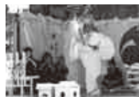
▲長岡稲葉山神社神楽