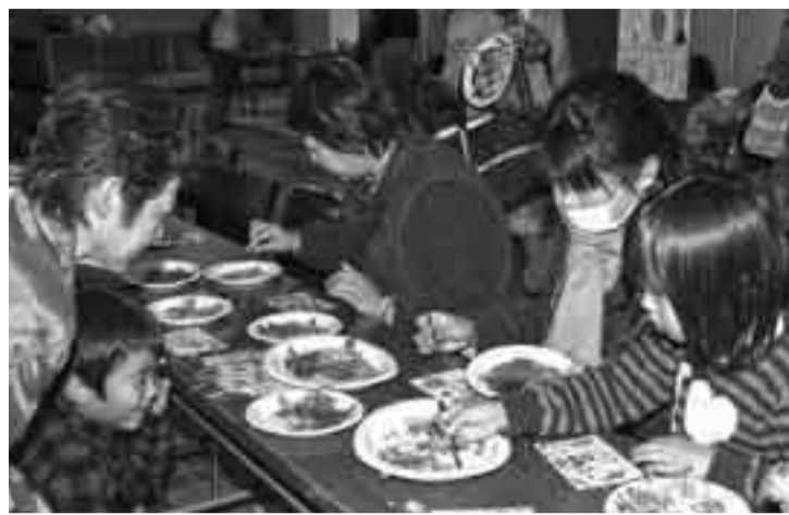
▲生涯学習フェスティバルの体験コーナー