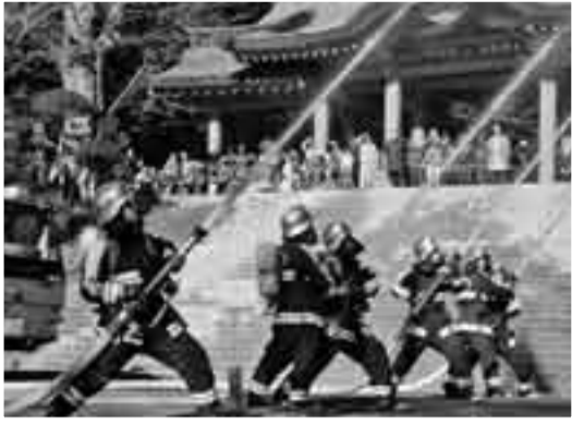
▲楼門前での放水訓練