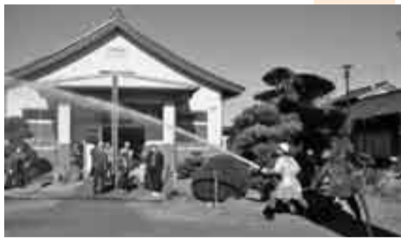
▲善雄寺でも放水訓練が行われた

香取市には、楽しいイベントや出来事が盛りだくさん。ここでは、そんなホットなまちの話題をご紹介します。