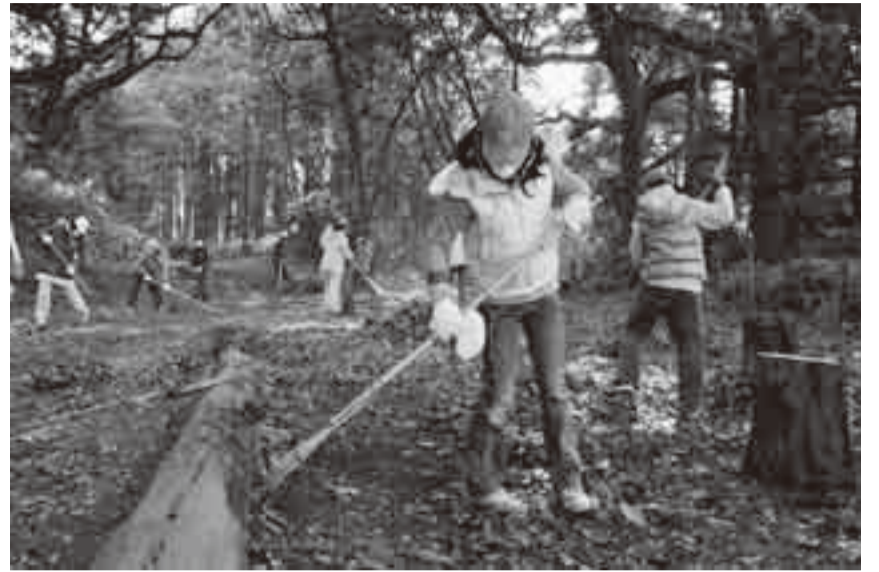
▲落ち葉拾いを行う津宮小児童たち