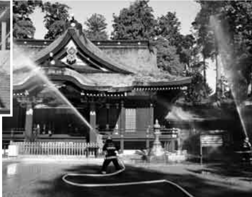
▲貴重な財産を守るため緊迫した消防訓練を行う消防署員

人命や地域の貴重な財産である文化財を火災から守るため、文化財防火デー(1月26日)を前に1月22日に香取神宮で佐原消防署、地元消防団、香取神宮職員などが参加して防災訓練が行われました。