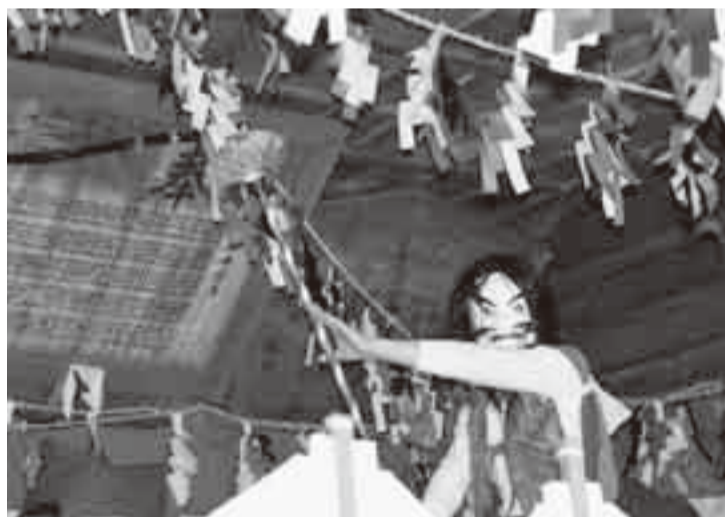
▲毎年3月3日の例祭に神楽殿で奉納される木内神楽