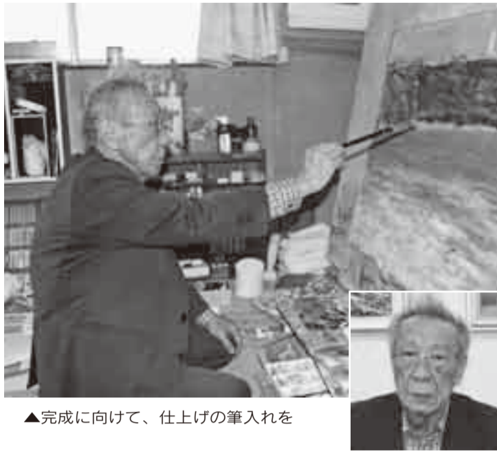
▲完成に向けて、仕上げの筆入れを