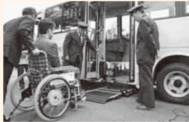
▲車椅子に乗ったまま乗降できるステップリフト

小見川区循環バスが、10月1日に実証運行を開始しました。循環バスは車椅子利用者も安心して乗降できるステップリフト付で、通学、通院、買い物など、市民の皆さんの利便性の向上と、外出機会の確保に配慮し運行されます。