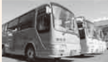
▲車体の色は市の花「あやめ」、市の木「桜」をイメージ

小見川区循環バスが、10月1日に実証運行を開始しました。循環バスは車椅子利用者も安心して乗降できるステップリフト付で、通学、通院、買い物など、市民の皆さんの利便性の向上と、外出機会の確保に配慮し運行されます。