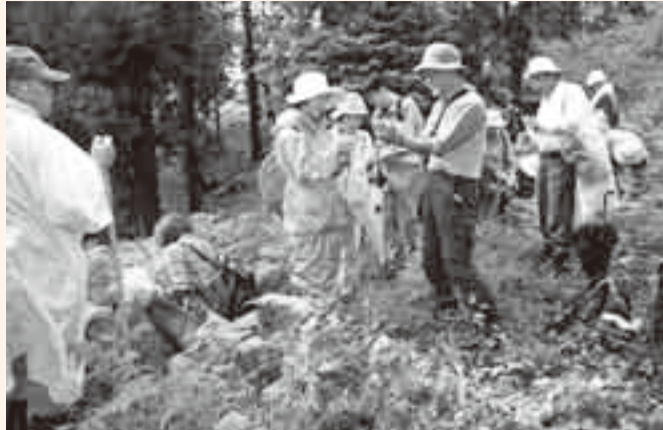
▲講師から草花の詳しい説明を受ける参加者たち