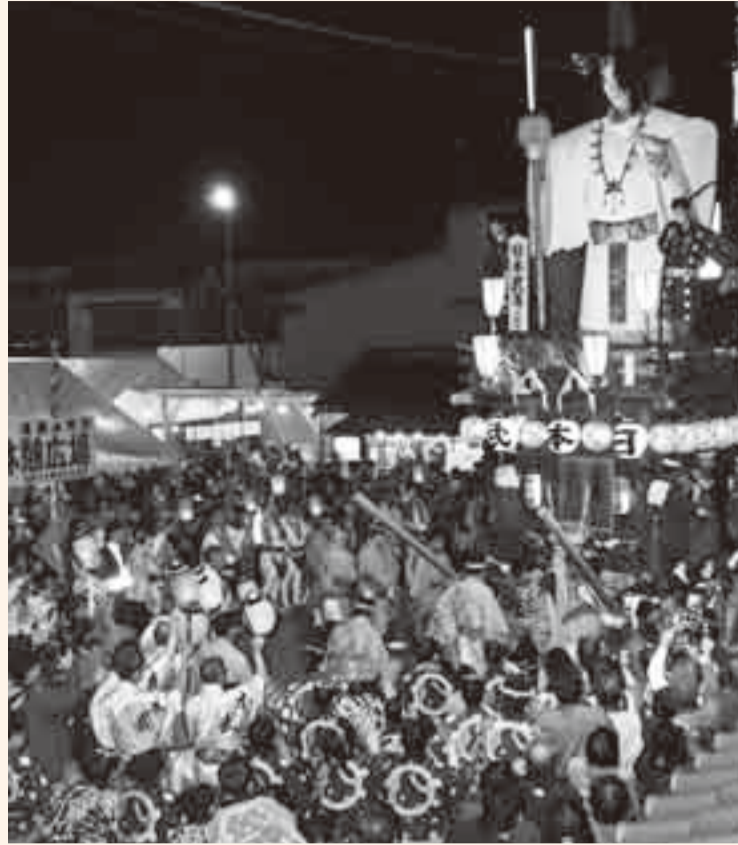
▲勇壮なの字廻しの披露でお祭りムードは最高潮に

佐原の大祭秋祭りが、10月9日から11日までの3日間、新宿地区で行われ、各町内自慢の山車が、佐原囃子の音色にのって曳き廻されました。 10日には、3会場に分かれて披露される、勇壮なの字廻しを一目見ようと、大勢の観光客が会場に押し寄せ、大変な熱気に包まれました。祭り期間中の来場者は65万人を超え、古い町並みが残る情緒豊かな小野川沿いは、普段とは一味違ったお祭りムード一色に染まりました。