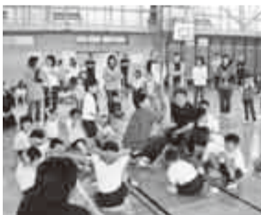
▲親子レクリエーション運動会の様子

家庭環境の多様化で核家族が増え、昔から伝わる当たり前の「おばあちゃんのお話」がテレビ番組で高視聴率をあげている現状は、現代の保護者の抱える悩みの大きさを表しているのではありません。子育てや家庭教育には、教科書もなく正解や不正解もないと思います。答えが無いからこそ、同じ悩みを持つ者同士が愚痴