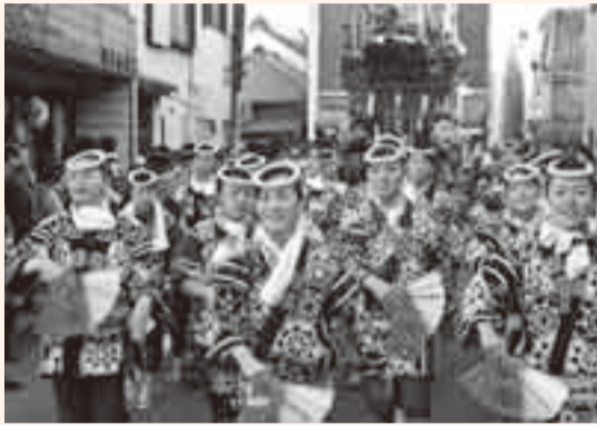
▲祭りに華を添える美しい女性たちの軽快な手踊り

佐原の大祭秋祭りが、10月9日から11日までの3日間、新宿地区で行われ、各町内自慢の山車が、佐原囃子の音色にのって曳き廻されました。 10日には、3会場に分かれて披露される、勇壮なの字廻しを一目見ようと、大勢の観光客が会場に押し寄せ、大変な熱気に包まれました。祭り期間中の来場者は65万人を超え、古い町並みが残る情緒豊かな小野川沿いは、普段とは一味違ったお祭りムード一色に染まりました。