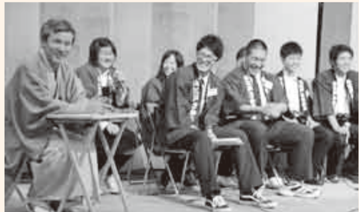
▲和やかな雰囲気の中、高校生らしい新鮮な意見が飛び交いました

長野県下諏訪町下諏訪漕艇場で、第18回全国市町村交流レガッタ下諏訪大会が開催され、本市から3クルーが参加。壮年女子の部で小見川博善社ローイングチームが3年連続優勝を飾り、成年男子の部参加のサンデーギナーズと議会議員シニアの部参加の香取市議会の2クルーが第4位に入賞しました。