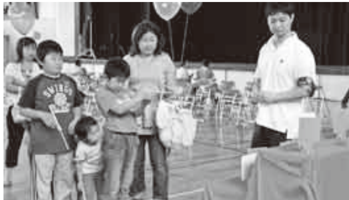
▲さあ、的を狙って、割り箸鉄砲の出来栄は？

地図のまち佐原2009「フレンドパークin香取」ともだち100人つくろうよ!」が6月21日、佐原小学校体育館で開催されました。あいにくの梅雨空となり、当初予定していたわんぱく公園では開催できなくなったものの、およそ800人の親子が集まり、割り箸鉄砲や紙粘土でのスフィンクス作りなどを楽しみ、交流を深めました。 また、イベント開催に合わせ、市内の小学5・6年生を対象に募集した、「香取市の好きな場所」絵画作文コンクール表彰も行われ、子どもたちの目線で描かれた、香取の魅力再発見となるコンクールとなりました。