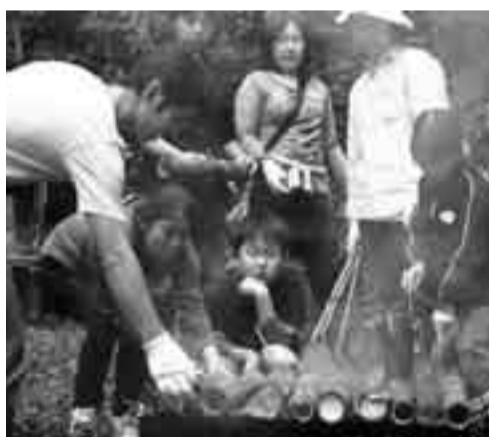
▲竹筒ご飯づくりに挑戦