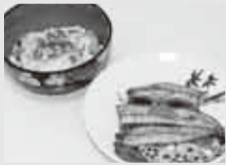
▲蒲焼を卵でとじた「うなぎ玉井」(左)

土用の丑の日には、暑気払いをしましょう。蒲焼を使った「うなぎ玉井」もおいしいです。