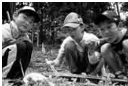
▲炊き上がったご飯を試食。お味は？