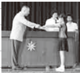
▲地図のまち・佐原2009 フレンドパークin香取での 表彰式(6月21日)