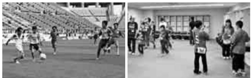
▲ピッチを裸足で駆ける子どもたち ▲普段入れない選手のロッカールームに大喜び

市のPRイベントを行うフレンドリータウンデイズ「香取市の日」が、6月20日にカシマサッカースタジアムで開催されました。会場では、地元特産品の販売や、佐原囃子と手踊りの披露、市長たちが市のPRパンフレットを配りました。また、ピッチやロッカールームなどを回るスタジアムツアーや、スポーツ少年団などの前座試合も行われ、普段入ることができない施設の見学やピッチでのサッカーを楽しみました。