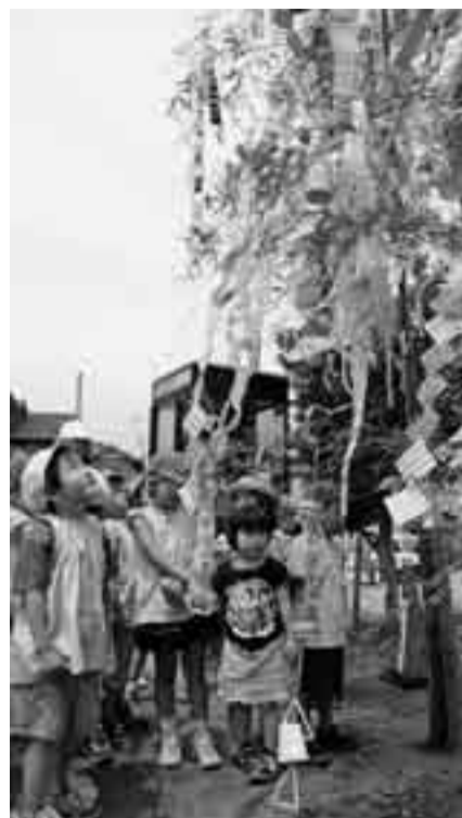
▲自分の短冊はどこかな？(JR香取駅前)

6月26日に、神道山ボランテイクラブの皆さん呼びかけにより、津宮幼稚園、津宮小学校、香取中学校、地域の皆さんが七夕飾りを、JR香取駅前に飾り付けし、7月3日には、小見川幼稚園園児が、JR小見川駅に飾り付けを行いました。