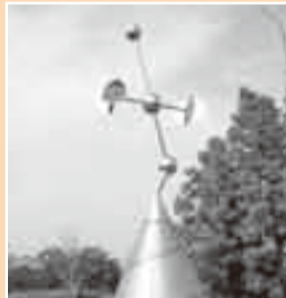
▲夏の星座(白鳥座)八都地区

山田区内には、北斗七星、カシオペア座、白鳥座をイメージした星のモニュメントが設置されています。澄み切った夜空に輝く星は、豊かな自然に囲まれた「星のふるさと」山田のシンボルとなっています。