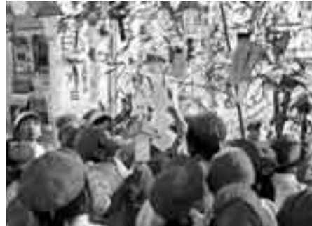
▲短冊を飾りつける園児たち(小見川駅)

6月26日に、神道山ボランテイクラブの皆さん呼びかけにより、津宮幼稚園、津宮小学校、香取中学校、地域の皆さんが七夕飾りを、JR香取駅前に飾り付けし、7月3日には、小見川幼稚園園児が、JR小見川駅に飾り付けを行いました。