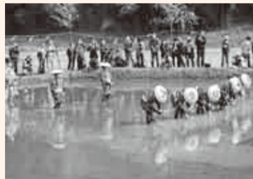
▲5日に行われた早乙女たちによる早苗植え

豊作を祈願する香取神宮の神事御田植祭が、満開の桜のもと、穏かな晴天の中執り行われました。植え始め行事として、かさと赤いたすきを付け「早乙女」に扮した地元女性たちにより、参道下にある「斎田」で田舞の歌に合わせた早苗植えが行われました。今では珍しくなった手作業での田植えに、多くの観衆を集めました。