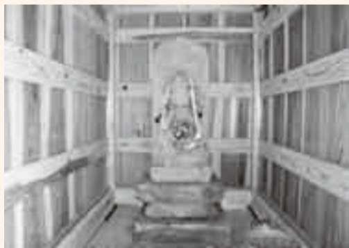
▲改修工事が終わり新しくなった観音堂

大根上谷津地区にある観音堂がこの度行われた改修工事で新しくなりました。前回は70年ほど前に改修したと伝えられています。堂内には、観音様の石仏が安置され、20年ほど前までは地元的女性たちによる「七観音参り」が行われていました。娘の出産を案じた親がお参りすることもあり、女性たちの信仰の対象となっています。