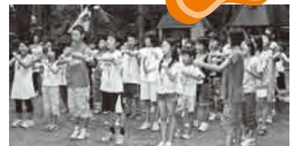
楽しかったキャンプ大会

学生・高校生が、香取市ジュニアリーダーズクラブにいます。このジュニアリーダーは、単位子ども会の応援、本部行事、県行事と活躍をし、友達の輪も広がっています。今後も地域に根ざした活動を目指して、地域の皆さんと一緒に活動します。