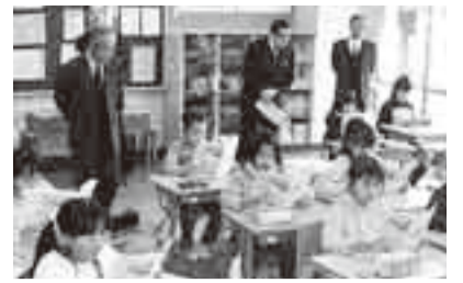
▲教育委員による授業参観