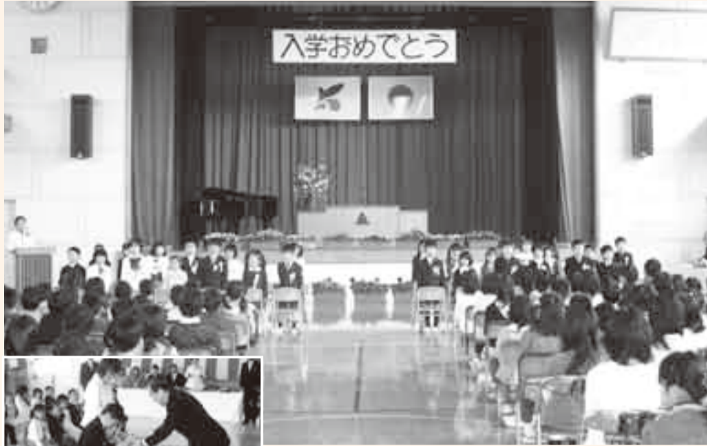
▲統合後初となる入学式での新入生紹介

◀犯罪から身を守るため、防犯ブザーを贈呈 (市教育委員会から市内全小学校へ配布)