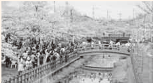
▲十間川さくら祭りでの手踊り披露

春の暖かな陽気に恵まれ、お花見日和となった4月4・5日は、市内各地で桜まつりが開催され、見頃となった桜と多彩な催しで、お花見客を楽しませました。