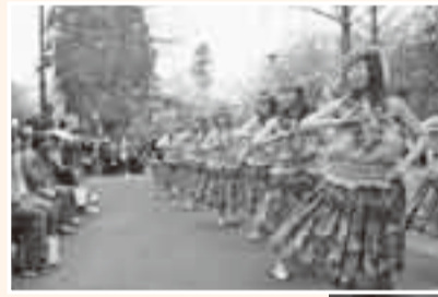
▲水郷おみがわ桜まつりでのフラダンス

十間川では、佐原囃子の演奏や手踊りの披露、城山公園では、ダンスやコンサート、栗源さくらの会による桜ヶ丘お花見会では、完成したばかりの遊歩道でお花見散策と、市内の桜の名所は、多くのお花見客で賑わいました。