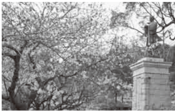
▲春には、桜の花の中にたたずむ銅像が見られる