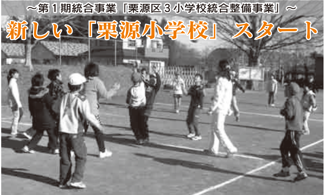
～第1期統合事業「栗源区3小学校統合整備事業」～