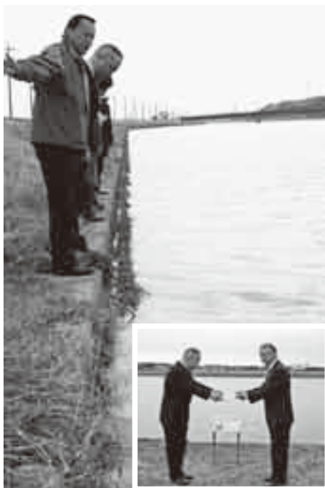
▲水生植物が育成するネットが設置された黒部川護岸。右下は引渡しの様子

黒部川を市民に親しんでもらえる川にと、財団法人リバーフロント整備センターから「自然再生護岸」が寄贈され、2月9日、設置場所の黒部川護岸で引渡し式が行われました。