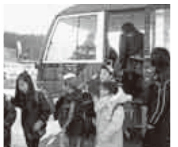
▲スクールバスの試乗体験