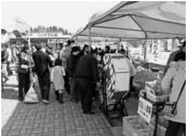
▲大当たりに願いを込めてお楽しみ大抽選会は大行列

「集団リハビリ教室つくしの会」の定例会が2月19日、小見川社会福祉センター(さくら館)で開催されました。この日は、ボランティアによる手品や日本舞踊が披露され、集まった会員たちは、時間を忘れて見入っていました。病气やけがなどが原因で身体機能に何らかの支障がある人と、その家族が集まり、お互いに日々の体験を発表したり、歌・ゲーム・小物作り・踊りなどを通じて、楽しく機能回復訓練を行っています。中には交通手段が無く、シルバー人材センターの送迎で参加する会員もあり、家の中に閉じこもりがちだった人が家族の勧めで入会し、その後は見違えるほど明るく元気になり、毎月の集まりを心待ちにしています。