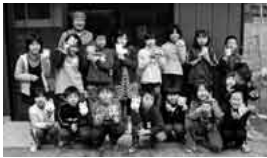
▲完成した張子と一緒に「ハイ、チーズ♪」