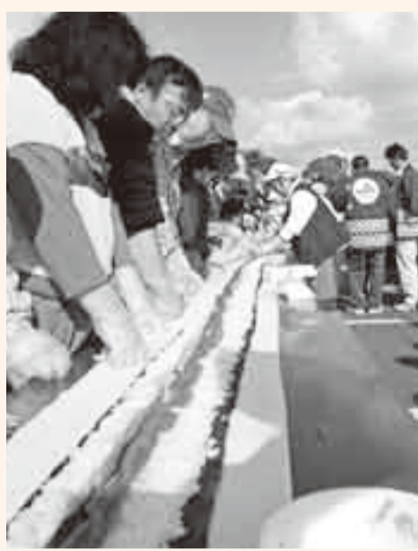
▲ジャンボ太巻き寿司に挑戦

会場内では特色のある、いろいろな催しに、子どもから大人まで秋の1日を楽しみました。