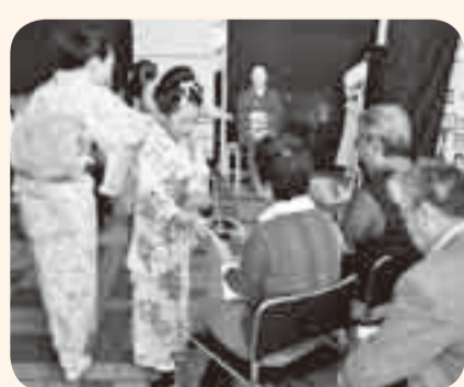
11月3・4日 小見川区事務所 11月10・11日 山田公民館

文化の日を中心に佐原・小見川・山田で文化祭が開催されました。会場には、絵画や書道、写真などの日ごろの成果が一堂に展示され、多くの人たちが展示された力作を鑑賞しました。