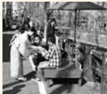
▲お客さんにお茶を振る舞う学生

佐原の町並み建物特別公開が11月3・4日に開催されました。特別公開には、県文化財の商店や旧家など7軒が協力。普段は内部を公開していない建造物もあり、見物客は昔の生活をしのぶ建物やカラクリ戸など知恵を絞った構造に驚きの声を上げていました。