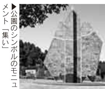
▶公園のシンボルのモニュメント「集い」

栗源区事務所の近くに「栗山川ふれあいの里公園」があります。 公園内には、はだし健康の道、遊具、ミニバスケットコート、芝生広場ゲートボール場があり、子どもからお年寄りまで幅広く楽しむことができます。 はだし健康の道は、幅1m、1周35mのコースに、大小の石や擬木、足形の反射ボードがあり、この上を