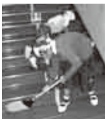
▲協力して掃除をする上学年と下学年

私たちの小見川南小学校は、縄文時代から人が住んでいた小見川地区の「長難台」という高台にあります。良文小学校という名前の頃からたくさんの方がこの学校で勉強してきて、今年度は、創立百二十周年を迎えます。現在の全校児童は、五十七名です。他の学校と比べると人数は少ないけれど、「いつも真剣、本気で取り組む」という校訓のもと、何にでも一生懸命に取り組んでいます。掃除の時間は、学年が下学年の面倒を見ながら全校で協力して、学校をきれいにしています。