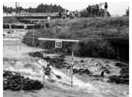
▲千葉県カヌースラローム大会の様子

2010年（平成22年）に、千葉県で行われる第65回国民体育大会「ゆめ半島千葉国体」では栗山川がカヌー競技の開催場所になります。