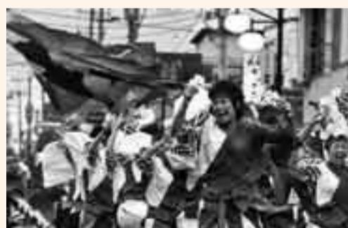
▲ホストチームである「おみが和よさこい 会和気満々」による躍動感のある踊り

子どもたちと耳の不自由な人との「やきいも交流会」が佐原みどり幼稚園で行われました。園児たちは、手話を交えた鼓笛演奏やおゆづぎなどを披露。焼きいもを片手に日ごろから練習している手話での会話をし、楽しいひと時を過ごしました。