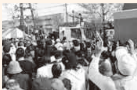
▲もちなげには多くの人たちが参加