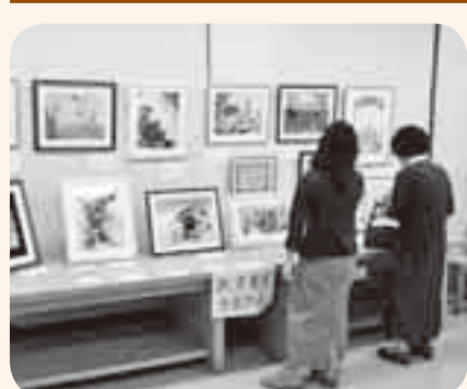
11月2・3日 山田公民館