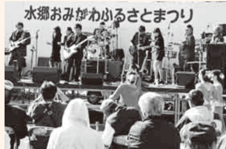
▲オールディーズ「スカーフェイス」のライブ