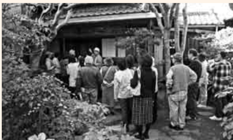
▲ボランティアさんから説明を聞く見物客たち

佐原の町並み建物特別公開が11月3・4日に開催されました。特別公開には、県文化財の商店や旧家など7軒が協力。普段は内部を公開していない建造物もあり、見物客は昔の生活をしのぶ建物やカラクリ戸など知恵を絞った構造に驚きの声を上げていました。