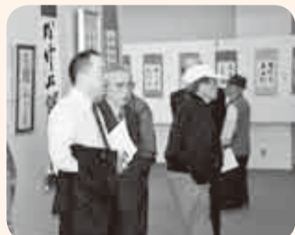
11月1～5日 佐原中央公民館・佐原文化会館