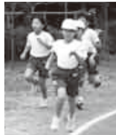
▲駅伝大会に向け一生懸命練習する児童

私たちがこうしてがんばれるのは、一緒に練習している仲間や先生方がいること、そして、下学年に心から応援してもらったり、家族や地域の方々にも励ましてもらったりしているからだと思います。人の温かさがあふれるこの南地区に住んでいる私たちは、とても幸せ者だと思います。