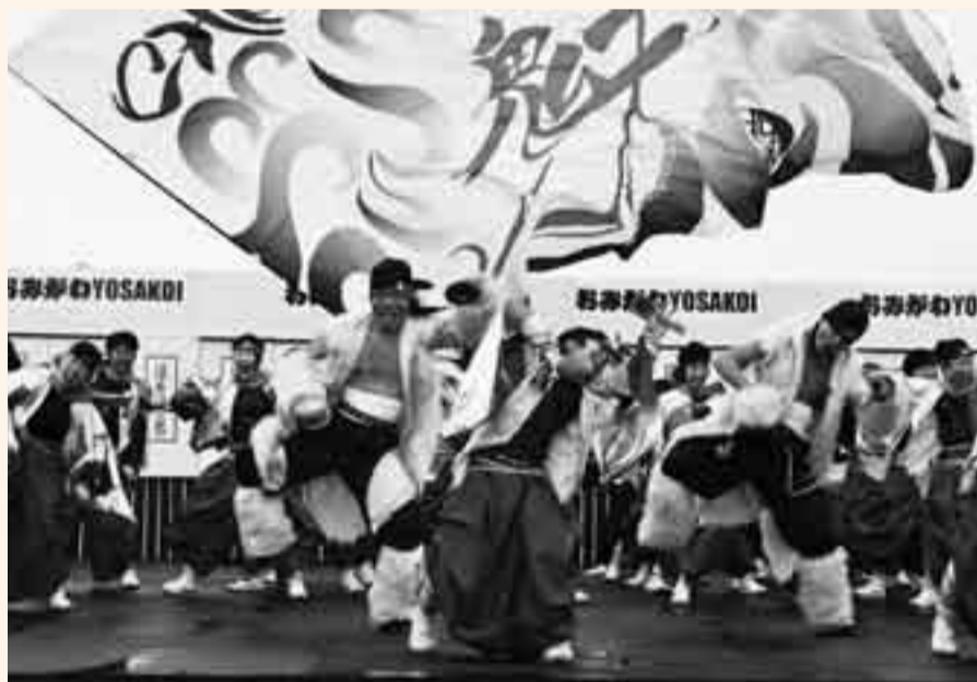
▲ゲストチーム「CHIよREN北天魁」による豪快な舞