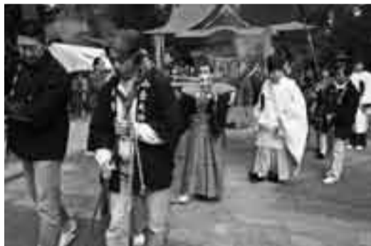
▶ 昨年の鮭祭りの様子