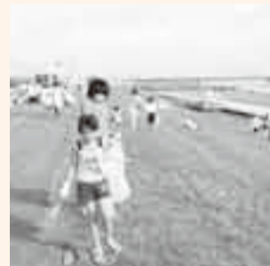
▲ ごみを拾う子どもたち

夏夜を彩る恒例の水郷おみがわ花火大会が8月1日、小見川大橋下流の利根川河畔で行われ大勢の見物客が訪れました。約8000発の花火が華々しく夜空を彩ると観客たちは、一大スベクタクルに大きな歓声を上げていました。また、翌日には地元の小中高生などにより河川清掃が行われ、前夜に見物客などが残したごみや花火の燃えかすなどが拾われました。