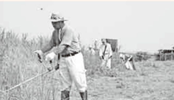
▲ 生い茂る雑草を自前の草刈機で刈るメンバーたち

夏夜を彩る恒例の水郷おみがわ花火大会が8月1日、小見川大橋下流の利根川河畔で行われ大勢の見物客が訪れました。約8000発の花火が華々しく夜空を彩ると観客たちは、一大スベクタクルに大きな歓声を上げていました。また、翌日には地元の小中高生などにより河川清掃が行われ、前夜に見物客などが残したごみや花火の燃えかすなどが拾われました。