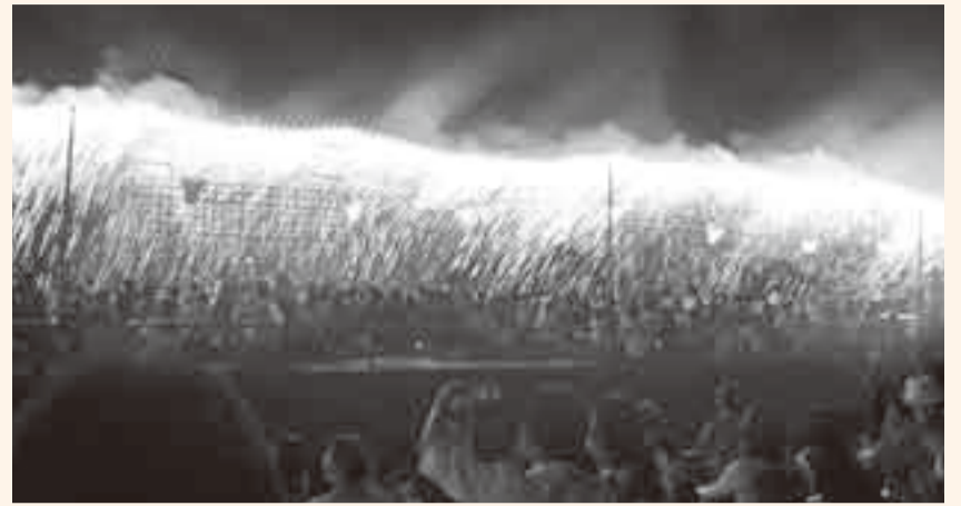
▲ 桟敷席に降り注ぎそうな花火「ナイアガラ」