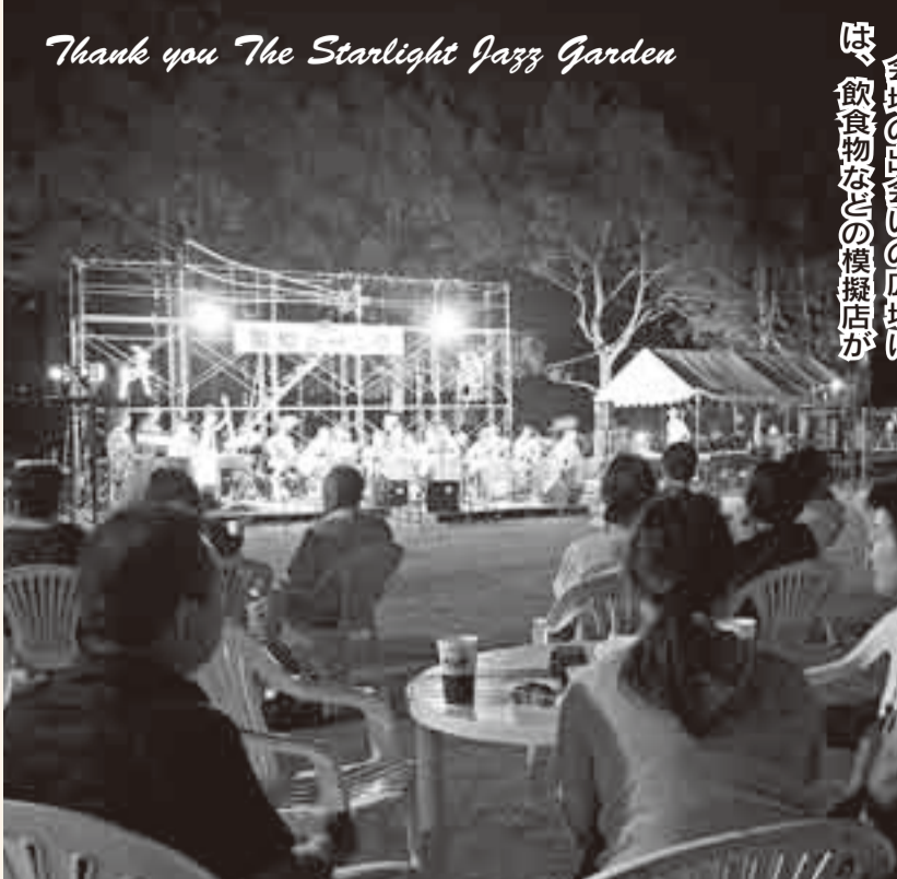
▲間に浮かぶステージで演奏されるジャズに耳を傾ける人たち

梅雨があげ本格的な夏が始まると真夏のサンタがやってくる。10年にわたり続けてきた夏のイベント「真夏のサンタ」。今年も7月28日、橘ふれあい公園で行われ、多くの人たちが夏の夜のひと時を楽しみに訪れました。 会場に出会った広場には、飲食物などの模擬店が立ち並び、訪れた人たちががとむるとおなじみとなった。たまたまビッグバンドにやってくる。10年にわたり続けてきた夏のイベント「真夏のサンタ」。今年も7月28日、橘ふれあい公園で行われ、多くの人たちが夏の夜のひと時を楽しみに訪れました。