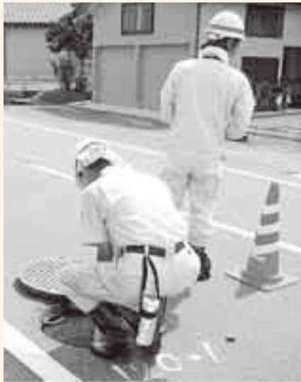
▲被災地で行なわれた被害調査の様子

新潟県中越沖地震の災害復旧のため、本市の下水道担当職員2人が7月30日から8月4日の6日間、新潟県柏崎市の被災地で支援活動を行いました。これは、(社)地域資源循環技術センターからの支援要請に応えたもので、地震により被害を受けた農業集落排水施設の管渠やマンホールなどの被害調査を実施しました。