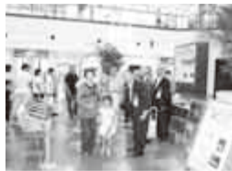
▲特産ベニアズマの無料配布