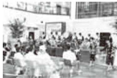
▲郷土芸能の演奏と手踊りの披露