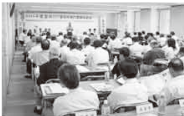
▲市役所で行われた総会の様子

同総会で香取市は、国体の開催にあたり、恵まれた自然、優れた伝統文化・豊かな資源を生かし、市民の英知と情熱を結集し、真心