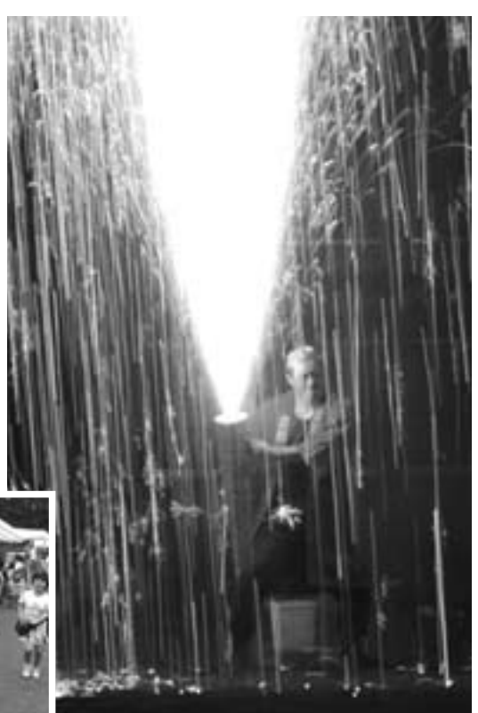
▲熱さとの戦い三河伝統手筒花火

栗源の夏まつりが8月19日に開催されました。会場には浴衣姿の子どもたちが見受けられ、夏まつりならではの風情あふれる夜となりました。中峰芸座の一番太鼓で夏まつりが始まると、和太鼓グループ「響」の体のしんまで響く演奏に観客たちは魅了され、大抽選会では当選番号が読み上げられるたびに、歓喜と落胆の声があがりました。メインイベントは多くの観客の度肝を抜いた三河伝統手筒花火。降り注ぐ火花の中で手筒を支える花火師の姿に驚きを隠せない表情で見守りつつ、称賛の拍手を送っていました。