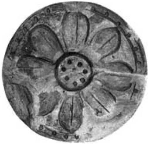
▲瓦当範は房総風土記の丘資料館に展示中

市内の伊地山・助沢・高萩・山倉地先などを源とし、太平洋に注ぐ栗山川。この川を望む台地上には、各時代の遺跡が多く存在し、また、低地に立地する栗山川流域遺跡群は縄文時代の丸木舟を出土することで知ら