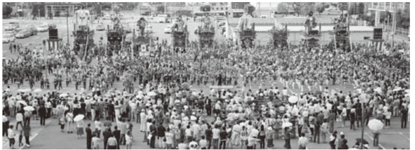
▲式典会場前には9台の山車が整列し総踊りや曲曳きが披露されました

フィナーレでは山田区「愛宕神社神楽」、小見川区からは「邦楽JOY」の演奏が披露されました。式典会場前には、佐原区の田宿、荒久、本川岸、八日市場、浜宿、寺宿、上宿、下宿および北横宿が整列し、山車の曲曳きにより総踊りや、山車の曲曳きが披露され、市民参加による盛大な式典となりました。 問い合わせ 総務課 ☎(50)1200