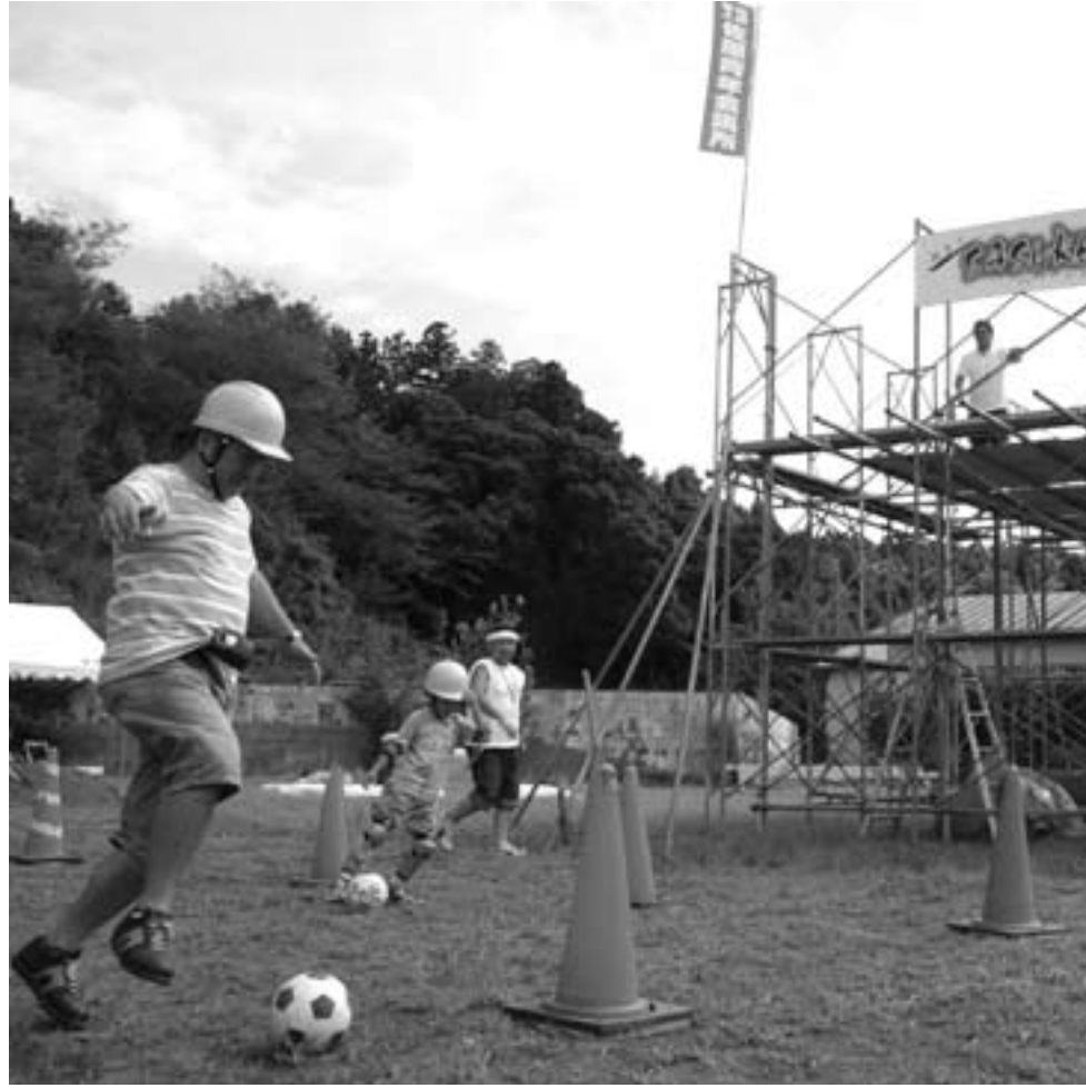
▲サスケに挑戦する親子

窯業技術に精通した工人集団がこの周辺に居住していたのです。将来、コジャ遺跡の近くで、この瓦当範でつくった軒丸瓦を焼いた瓦窯跡が発見されるかも知れません。