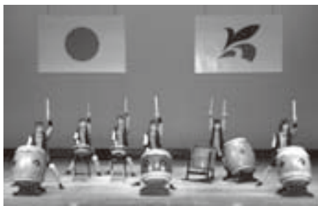
▲和太鼓「響」によるオープニング