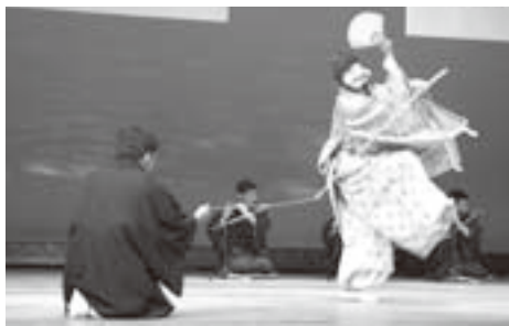
▲愛宕神社の神楽を披露