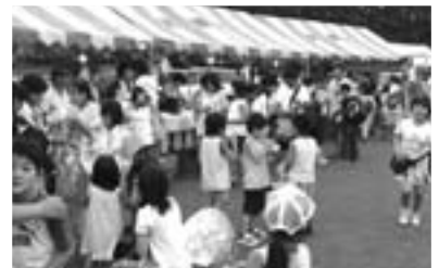
▲大勢の人たちが訪れたまつり会場