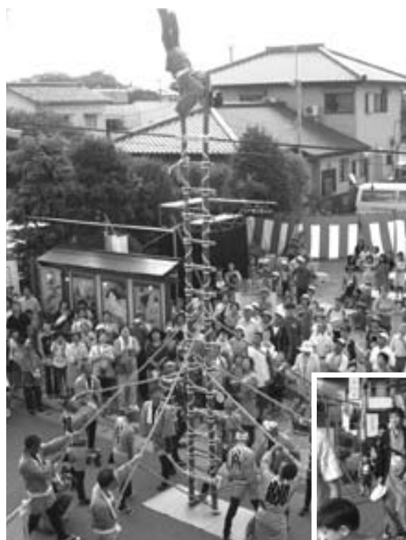
▲はしご乗りの技を披露

特設ステージでは、中央小郷土芸能部の演奏やものまねマジックショー、小見川若鷲会によるハシゴ乗りなどが披露されました。特に、江戸火消しを再現したハシゴ乗りが始まると、観客はハシゴを取り囲み、みごとな演技に見入っていました。また、小見川藩商人街とあつ