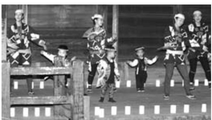
▲自慢の手踊りを披露する出演者

イベント「さわら・町並み・夕涼み」ゆかたで楽しむ灯りと音」の最終日となる8月19日、伊能忠敬旧宅前で佐原ばやし手踊り自慢が行われました。夜の帳が下り会場には、ろうそくの灯りで舞台が出現。5組の出演者が恵壽美會による下座演奏にあわせ手踊りを披露しました。各出演者は、祭りとは一味違う灯りの中での手踊りで、観客たちを魅了していました。このほか、長唄と尺八の演奏も行われ灯りと音の演出に華を添えました。