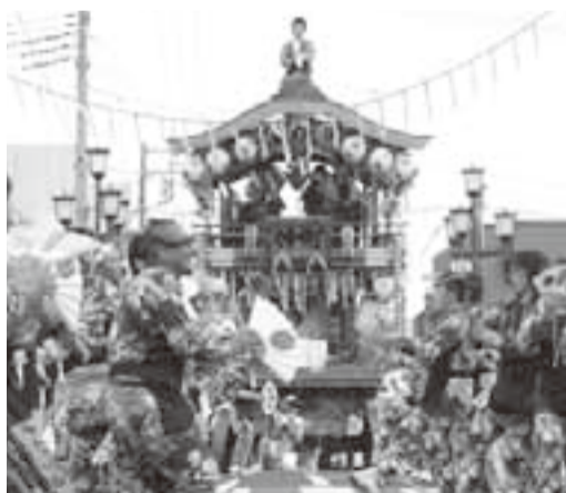
▲年番町の仲町による手踊り

小見川祇園祭中日の7月22日に第5回黒部川イルミネーション点灯式が開催されました。 会場となった大橋では、フラダンスやブラスバンドの演奏、よさこい囃子