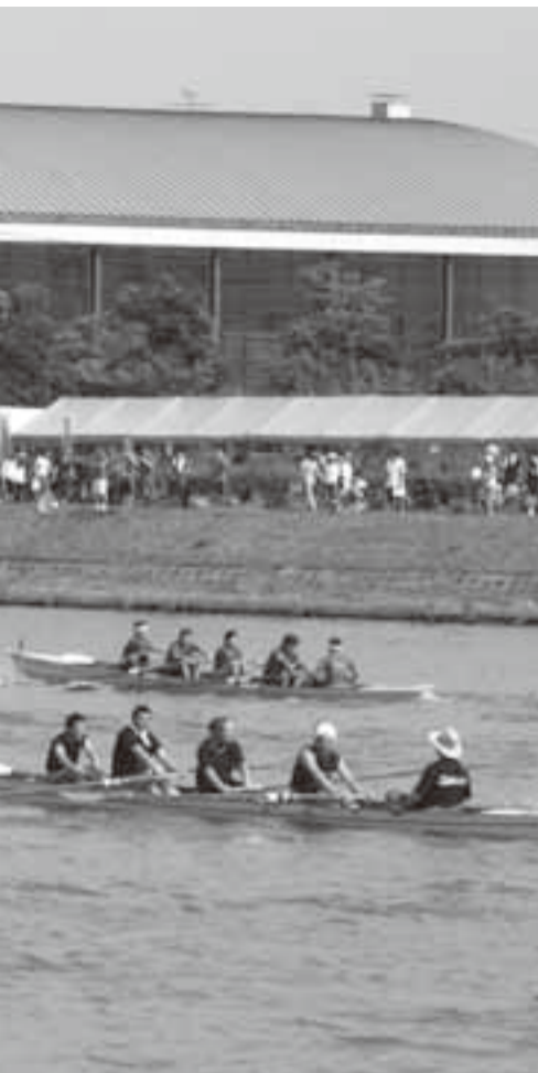
▲絶好のレガッタ日和となった大会当日