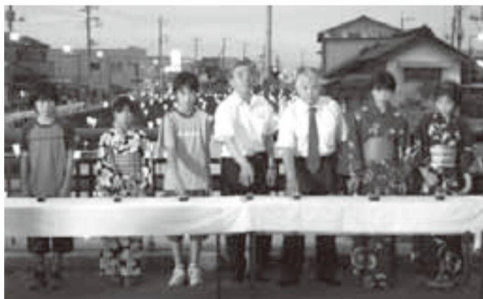
▲スイッチを押してほんぼりが点灯

小見川祇園祭中日の7月22日に第5回黒部川イルミネーション点灯式が開催されました。 会場となった大橋では、フラダンスやブラスバンドの演奏、よさこい囃子