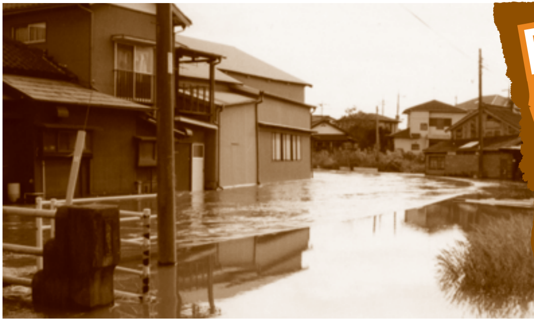
▲平成 11 年 10 月 27 日の大雨による小野川の増水

7月には活発化した梅雨前線が、山陰地方から関東の東海上までのびた影響で、長野県をはじめ各地で豪雨による大きな被害がでました。集中豪雨は雨量が急激に増加し、大きな被害になることがあります。また、9月から10月にかけて、台風の上陸が多くなるため、十分な注意と対策が必要です。9月1日は防災の日。もう一度災害に対する備えを再確認しましょう。