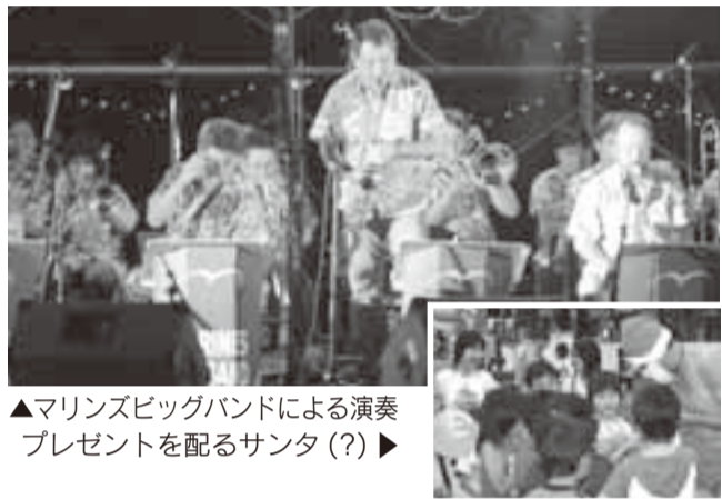
▲マリンスビッグバンドによる演奏プレゼントを配るサンタ(?)▶

博善社ローイングチーム」、ミックスの部では「ポムポムプリン」が優勝しました。 また、仮装したクルーの中で、首からきゆうりを下げた全員カッパ姿の女子クルーが会場を笑いで盛り上げ、ユニーク賞を受賞しました。