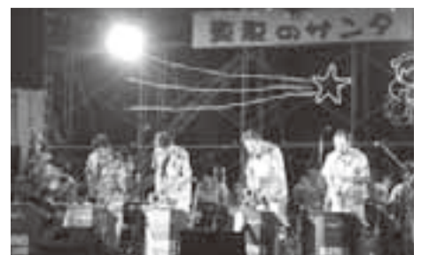
▲ジャズを演奏するマリンズビッグバンド