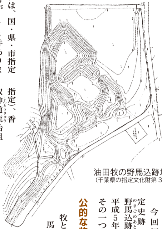
油田牧の野馬込跡地形図 (千葉県指定文化財第3集から)

市には、国・県・市指定文化財が178件あります。このうち分類として最も多いのは史跡になります。前回紹介した貝塚もこの史跡に分類されます。市内の史跡は、この貝塚のほかに伊能忠敬旧宅(国