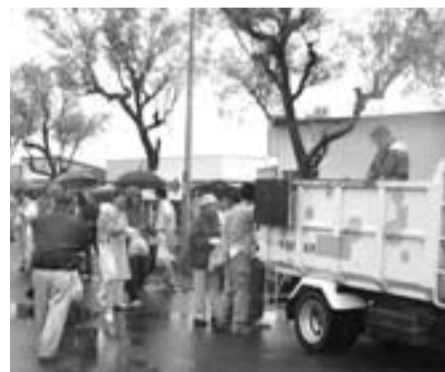
▲雨の中トラックにゴミを運ぶ参加者

ゴミの散乱防止とリサイクルを目的とするゴミゼロ運動が、5月28日に行われました。この日は悪天候にもかかわらず、朝早くから市内各地で約2800人が参加し沿道の草むらや空き地に投げ捨てられた缶やびんを拾い集めました。この日市内全域で収集したごみの量は6220キログラム、そのうち約9割があき缶でした。これらはリサイクルされることとなります。