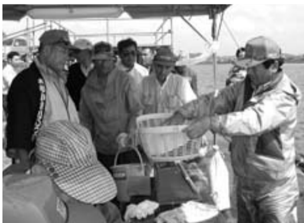
▲真剣な眼差しで計量を見つめる参加者