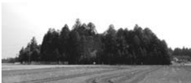
▲九美上地先に現存する野馬込跡

である牧士と勢力人足により行い、良馬は幕府へ送られます。そのほかは農耕馬や荷を運ぶ馬として民間へ払い下げられました。この際に野馬を追い込んで選別する施設が野馬込(捕込、込とも呼ばれる)です。一辺が60メートルほど、高さが3メートルほどの土塁で囲まれた区域で、選別のために内部が3部屋に区画されています。