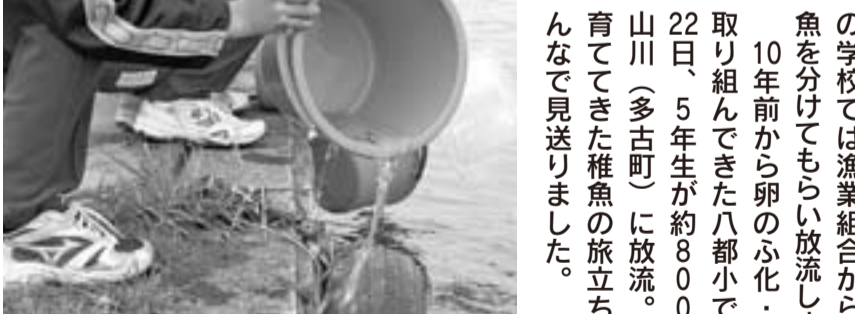
▲5センチにも満たない稚魚を優しく放流する子どもたち

「鮭がまだそこを泳いでいるよ——子どもたちが水面をのぞき込み、放流したばかりの稚魚を目で追いかける光景が、この春あちこちで見られました。鮭は昨年、市内や近隣の町で多数目撃。川をきれいにする活動とも重なり、市内のいくつかの学校では漁業組合から卵や稚魚を分けてもらい放流しました。10年前から卵のふ化・飼育に取り組んできた八都小でも3月22日、5年生が約800匹を栗山川(多古町)に放流。大事に育ててきた稚魚の旅立ちを、みんなで見送りました。