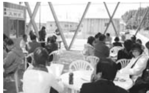
▲写真奥がラウベ(宿泊施設)

暖かい春の日差しがふりそそぐ4月1日、クラインガルテン栗源で入村式が行われました。テープカットの後、利用者の皆さんはさっそくラウベへ。縁側で日なたぼっこをしたり、お隣さんにごあいさつしたり、農業指導インストラクターとの交流をしたり…。これからの農家ライフに胸をふくらませ、とてもこやかな表情でした。