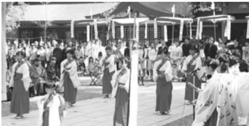
▲古式ゆかしい衣装で参列する稚児や少女たち

周囲にはたくさんの観光客が集まり、早春をつげる古式ゆかしい行事に興味深く見ていました。