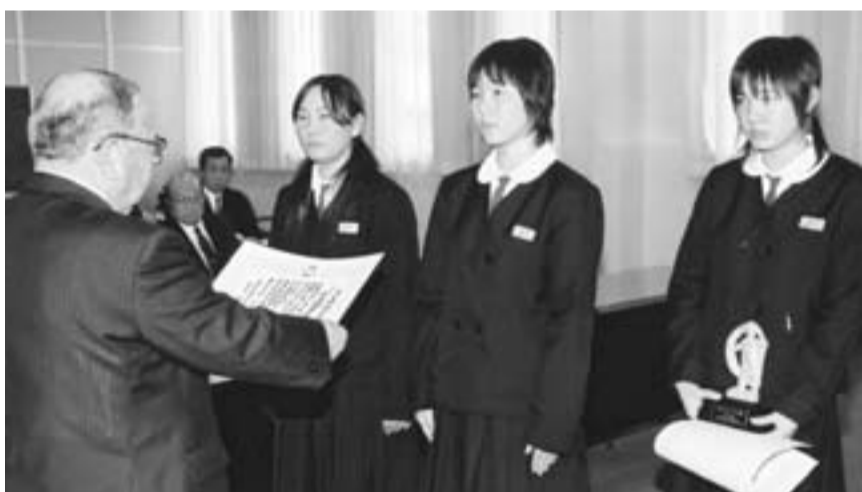
▲緊張の面持ちで表彰を受ける皆さん

青少年育成小見川町民会議が、3月12日に小見川町民会議(現文化会館)で開かれました。この会議の中で、清掃活動やレクリエーションのボランティア活動、芸術や文化活動など、善意や親切心からよい行いをした青少年に、「おみがわ少年賞」が贈られました。