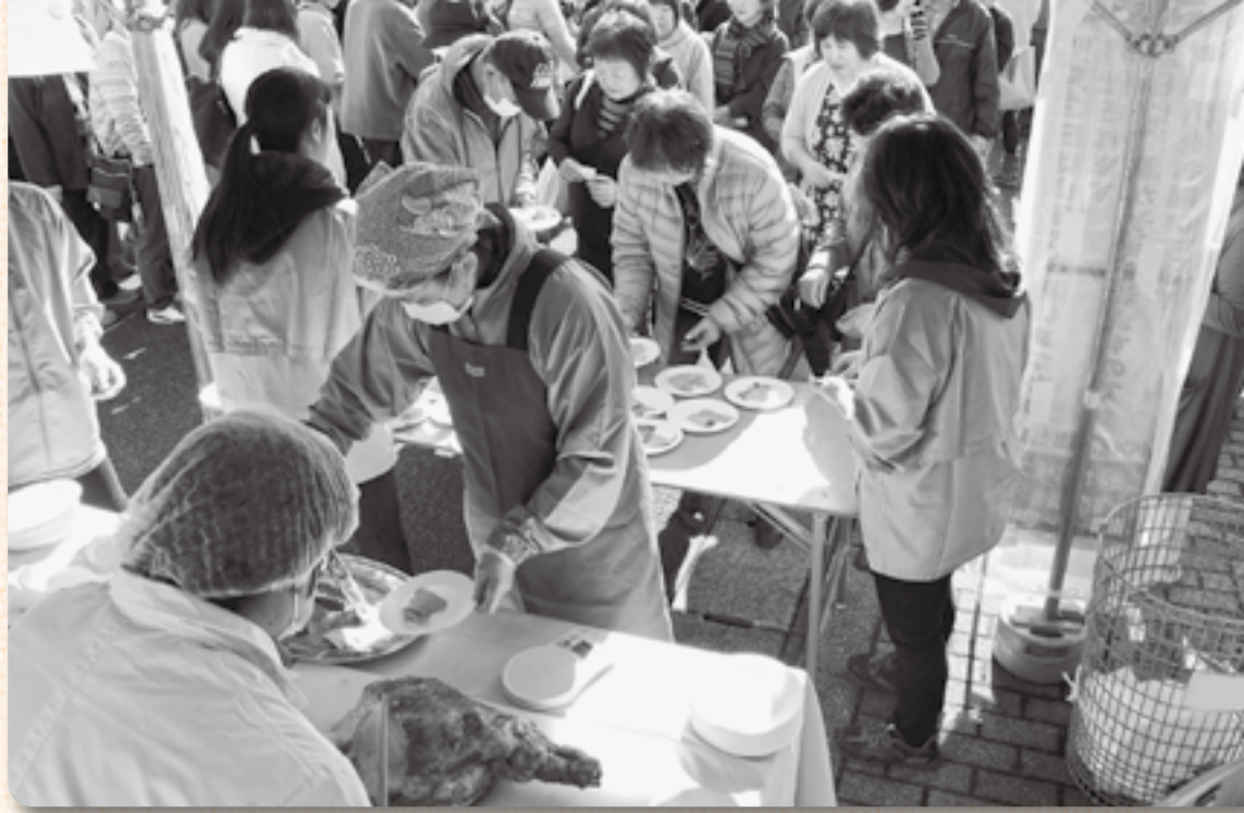
▲目の前で巨大ハムが切り分けられます