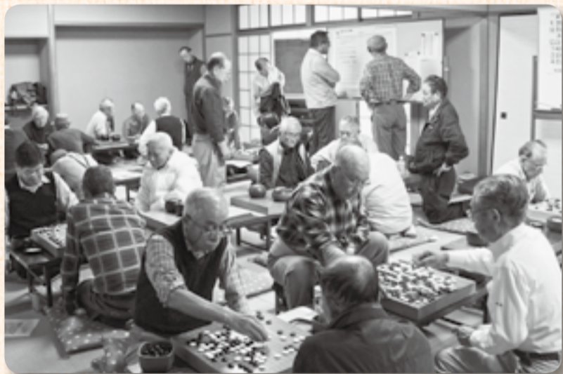
▲対局が終わっても感想戦に突入します

市内各地で10月29日から11月6日まで文化祭が開催されました。佐原会場の佐原中央公民館と佐原文化会館では、芸術作品の展示をはじめ茶道・将棋・囲碁の体験や、舞台の発表を見ようと大勢の人が集まり、思い思いに“芸術の秋”の時間を過ごしていました。