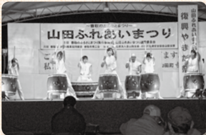
▲11月2日の前夜祭では和太鼓「舞華」の演奏も