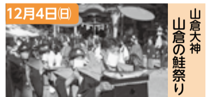
山倉大神 山倉の鮭祭り