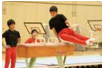
▲あん馬の旋回練習

私たち佐原中学校体操部は、2年生1人、1年生5人の計6人で活動しています。今年度は、3年生の先輩が全国大会出場を果たしました。先輩たちを見習い、自分にとって最高の演技ができるように、一日一日の練習の積み重ねを大切にしていきたいです。