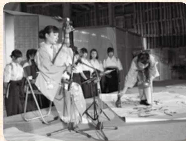
▲研ぎ澄まされた所作も作品の一つ

10月30日の与倉屋大土蔵には、佐原高校演劇部・書道部や小見川中央小学校郷土芸能部などが登場。こ