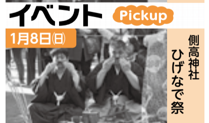
側高神社 ひげなで祭