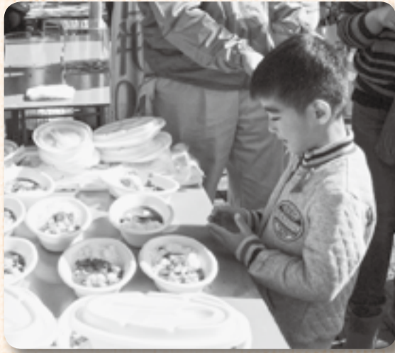
▲ゴロゴロ野菜のカレーにくぎ付け