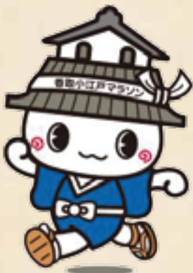
▲大会キャラクターかともる