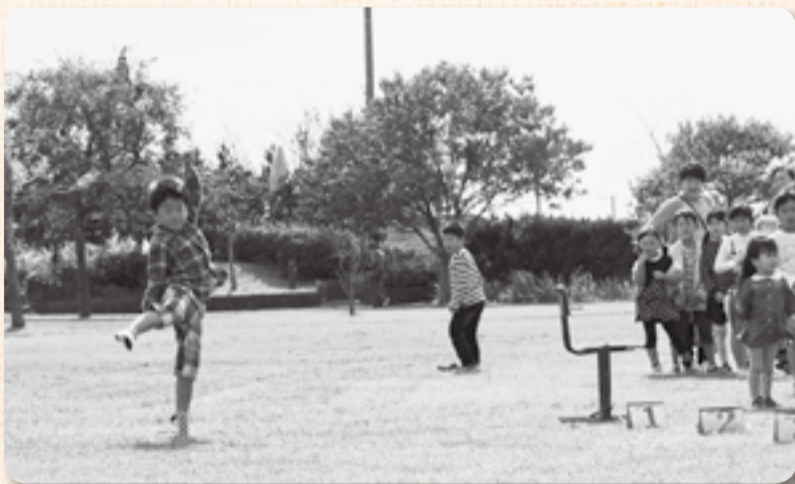
▲力だけでは遠くへ飛びません

10月23日、水郷小見川少年自然の家で行われた自然の家まつりでは、けん玉大会に竹馬コーナー、ポニーの乗馬体験など子どもたちの興味をひく催しがたくさん。訪れた子どもたちはあっちで遊んでこっちで遊んで、と落ち着く暇もなく駆けまわっていました。