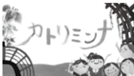
「カトリのミナが映る、ミナでつくる」 —広報動画カトリミナ

広報アンケートに合わせて、市内の中学生に動画に関するアンケートを行いました。それを受け、AR動画とYouTubeチャンネルは、名称を「カトリミナ」と変えてリニューアルしました。