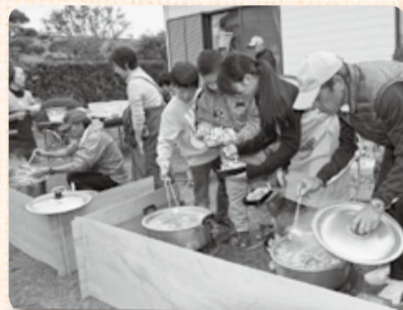
▲子どもたちも具材を鍋に入れ、お手伝い

朝から冷え込んだ10月30日に入会地コミュニティセンターでは、地域住民参加の防災訓練の後、炊き出し訓練も兼ねた芋煮会が行われました。7年続くこの芋煮会は、県外出身者の多い入会地地区で地域の皆が集まれ