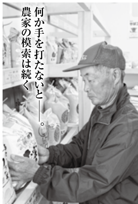
何か手を打たないと農家の模索は続く

稲作従事者は平均72歳 同様に深刻な問題が、農業従事者の高齢化だ。現在、香取地域の農業従事者の平均年齢は69歳。稲作では、72歳を超える。地域の高齢化した農業従事者が離農していくのはすでに時間の問題。それに伴い、耕作放棄地の急激な拡大も危惧されている。