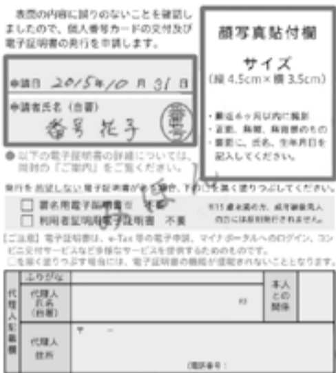
※個人番号カード 交付申請書みほん

詳しい社会保障・税番号制度はホームページ(内閣官房)をご覧ください。 ☎ http://www.cas.go.jp/jp/seisaku/bangoseido/