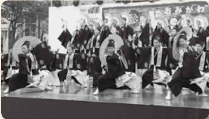
▲おみが和よさこい会「和気藹々」は「歌舞伎」がテーマ