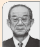
叙位・叙勲 正六位 瑞宝双光章