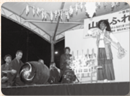
▲復興やまだ祭りでの長岡の夜神楽