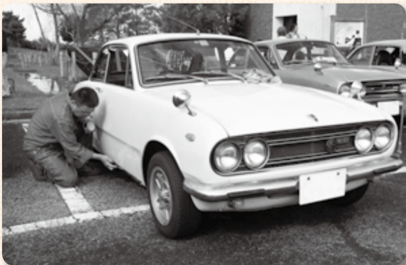
▲細部まで手抜きなし

県立中央博物館大利根分館で、昭和30年代～60年代の名車の数々が11月3日に展示されました。会場には往年のスカイラインやフェアレディなど、70台を超えるオールドカーやバイクがずらり。その様子に、訪れたたくさんのオールドカーファンの目は磨き上げられた車体同様にキラキラと輝き、オーナーの「同じようだけどエンブレムが違うんだ」「このパーツがなかなか手に入らなくて!」というこだわりや整備の苦労話に興味深そうにうなずいていました。