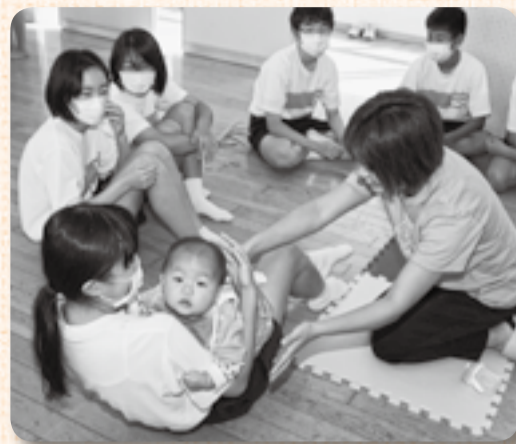
▲そーっと抱っこ、先生いかがですか？

10月27日・29日、佐原第五中学校の教室から赤ちゃんの声が聞こえてきます…？ これはNPO法人ママの働き方応援隊による赤ちゃん先生プロジェクト。赤ちゃんとお母さんが学校へおもむき、赤ちゃんとのふれあいを通じて癒し、笑顔、命の尊さを伝えるもので、2年生の生徒59人が