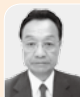
秋の叙勲 旭日双光章