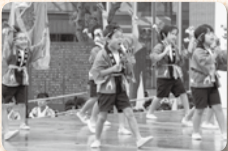
▲小見川幼稚園の園児も負けじと全力演技