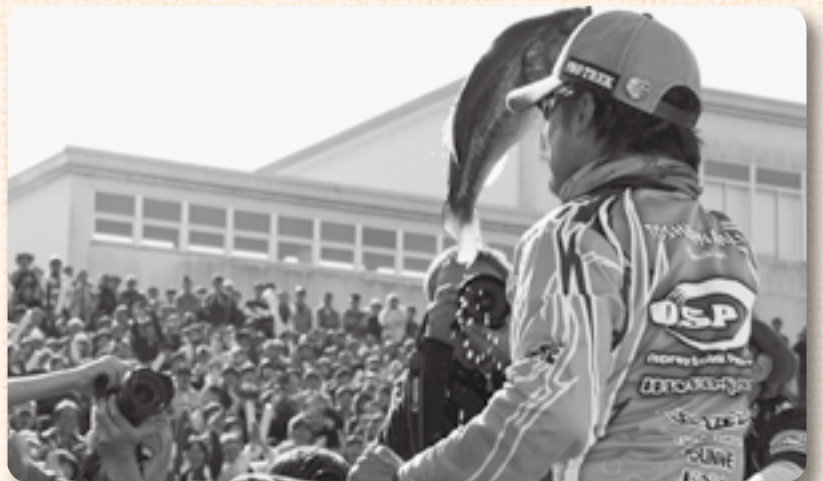
▲「ナイスフィッシュで〜す!」の大歓声

大会には日本を代表する20人のトッププロが参加し、利根川、霞ヶ浦、北浦などの広大なエリアをボートで疾走。会場内のメーカーブースで釣りざおなどが当たるくじ引きやセミナーが行われ来場者を楽しませたほか、選手が釣り上げたブラックバスを披露する「ウェイインショー」では、大物が披露されるたびに観客席から大歓声が沸き起こりました。