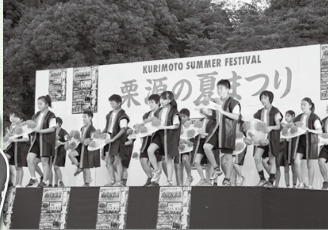
▲お手製の花笠を持ち、さあ踊りの始まり！