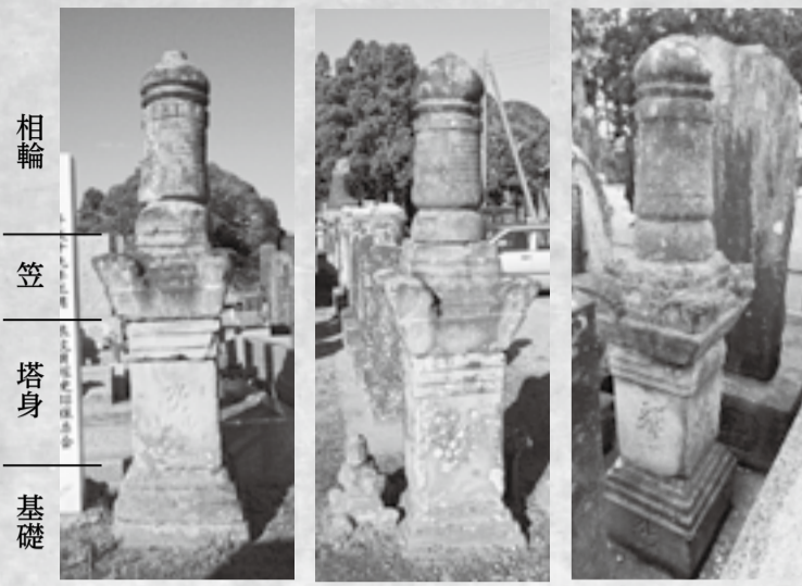
▲左から、府馬左衛門尉時持塔・神野角助塔・守庚申塔

宝篋印塔は、宝篋印陀羅尼經を納める塔で、平安時代に我が国に伝わったと言われています。鎌倉時代以降には全国的に広まり、供養塔や墓石などにも使われるようになりました。多くは、基壇(返花座)・基礎・塔身・笠・相輪を積み重ねる形になっています。