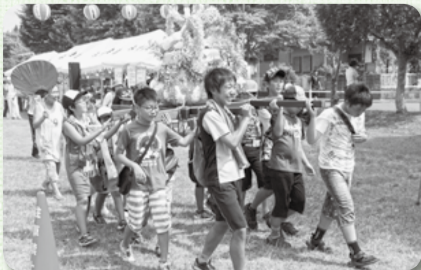
▲寺内公園の外周を練り歩き

また、会場では地震体験車への乗車などの防災訓練も行われ、参加者は震度5・6クラスの大地震を体験。揺れが起きているその瞬間にどれだけ動けるかを体感することができました。