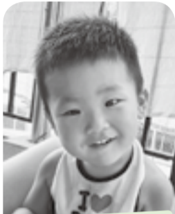
いつも元気いっぱい! お祭り大好き妹人くん