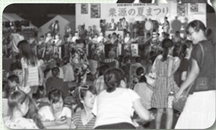
▲「あれ、来てたの!？」そんな声が聞こえてきそう