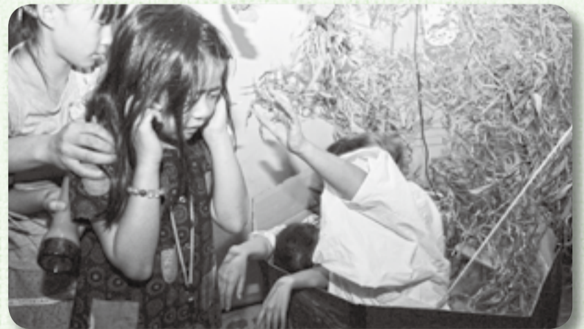
▲恐る恐る進む子どもたち