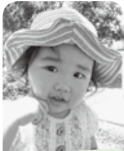
ダンス大好き♪弟大好き♡ 楽しい事大好き!