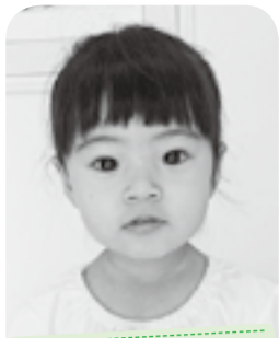
歌とダンスが大好き! おてんば娘♡