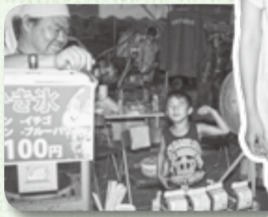
▲狙いを定めて、そーっとね