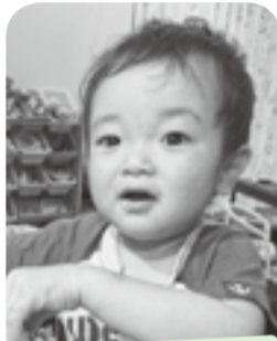
甘い物大好き♪ 秋にはお兄ちゃん!!