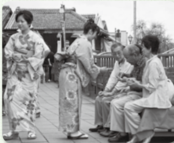
▲高校生が浴衣姿でおもてなし

小野川沿いの忠敬橋近くに差し掛かると、琴や笛の音が聞こえてきました。思わず足を止める観光客に声をかけるのは、佐原おかみさん会のメンバーと、千葉 ほつよう 陽高校の茶道部の生徒たちです。