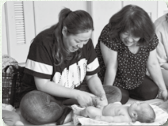
▲マッサージを受けリラックスする赤ちゃん

生後6カ月までの赤ちゃんとお母さんの母子8組が参加し、ブドウの種から抽出したオイルを使い、赤ちゃんの体を優しくマッサージしました。