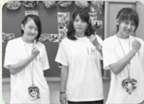
▲クラスのみんで力を合わせて完成