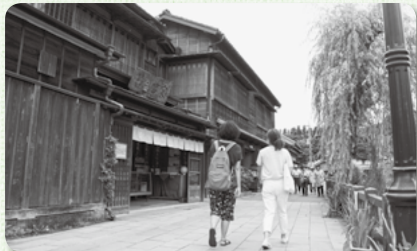
▲趣のある町並みの散策を楽しむ観光客

今回掲載された「佐原」は、星の評価こそありませんが、史跡や記念建造物が旅行者に推奨したい場所として高く評価されたことを表しています。