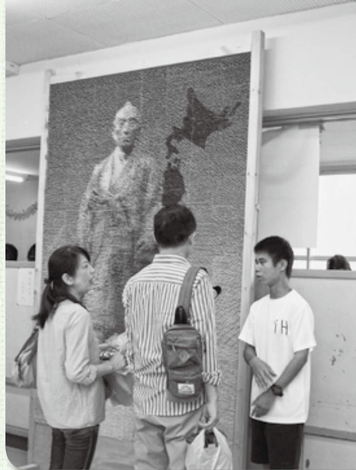
▲来場者に制作過程を説明する1年H組の生徒