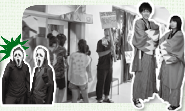
楽しくホットなまちの話題をご紹介します