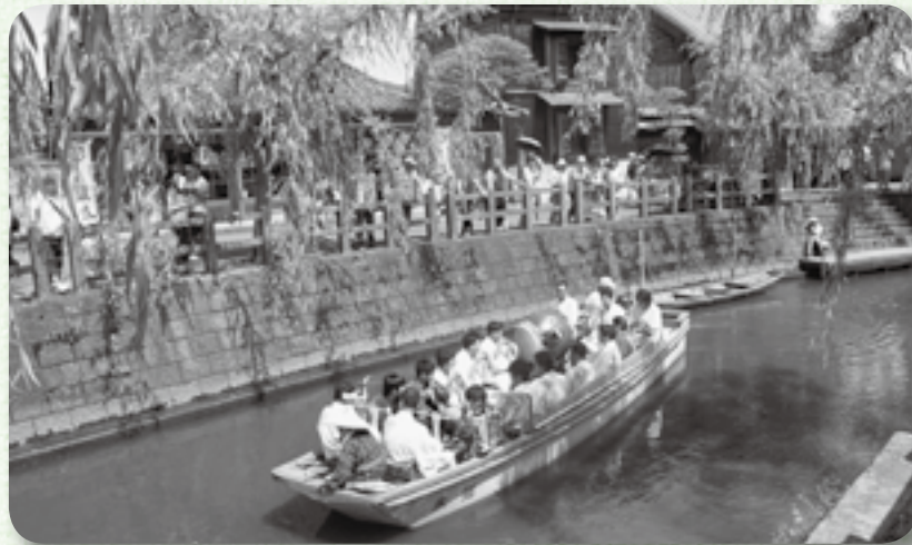
▲下座連「葦切会」による演奏