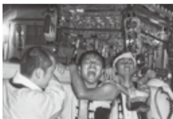
▲八日市場の八坂神社(7月18日)