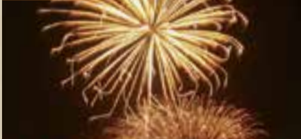
水郷おみがわ花火大会