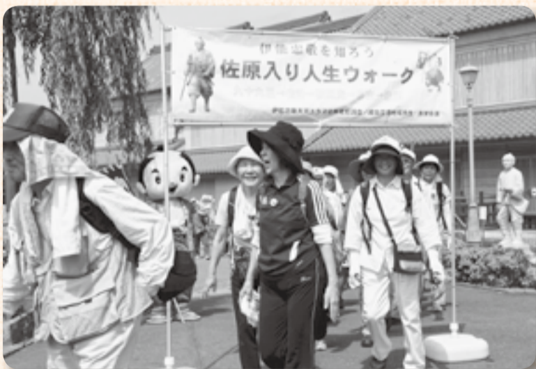
▲ゴール地点は伊能忠敬記念館

伊能忠敬の人生をなぞって、出生地である九十九里町から婿入りした香取市までを歩く「佐原入り人生ウォーク」が5月29日から31日まで行われ、延べ300人を超える参加者がゴールまでの5市町を思い思いにウォーキングしました。そのうち3日間完歩者は28人で、その歩行距離は57km! 雨が降る日もあった中で、見事3日間を歩ききった人たちは「ずぶぬれで大変だったけど、楽しかったね」と互いの健闘をたたえ合っていました。