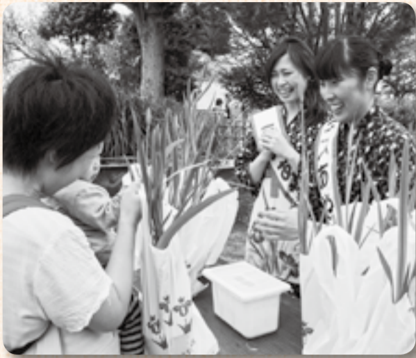
▲先着100人のプレゼントは大好評