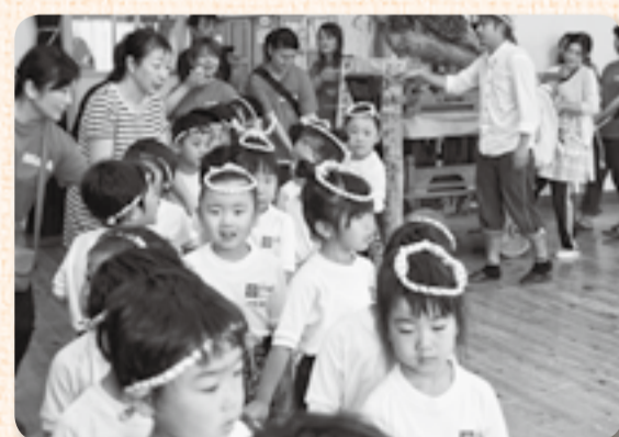
▲「ワッショイ!ワッショイ!」と元気に曳き廻す

例年は小野川沿いで行う行事ですが、今回は雨のため、今年度で移設が決まっている佐原幼稚園園舎内で実施されました。園児たちは、元気いっぱい鯉と鷹の飾り物が載った2台のミニ山車を曳き廻した後、日の丸扇子を使った可愛らしい手踊りを披露しました。