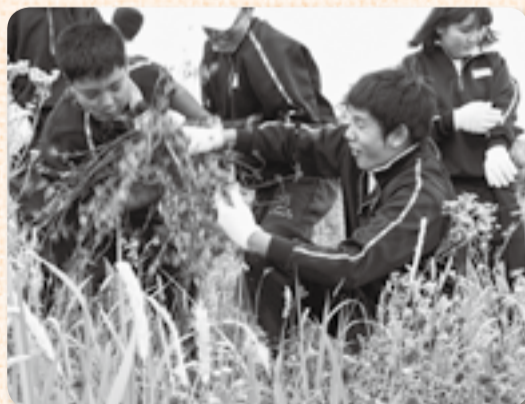
▲外来種のムラサキツメクサを引き抜く

昨年卒業した3年生たちが、チガヤやカワラナデシコなどの在来植物を堤防に植栽しました。これは日本だけではなく世界でも初の試みで、重大なプロジェクトを引き継いだ生徒たちは、先輩たちの植えた在来植物のスケッチを行った後、生育の妨げとなっている外来植物の抜根を全員で力を合わせ行いました。