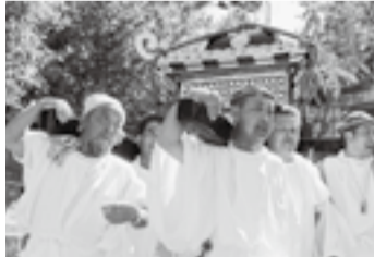
▲篠原本田の八坂神社(7月19日)