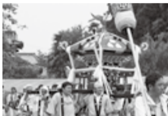
▲田部の日宮神社(7月11日)