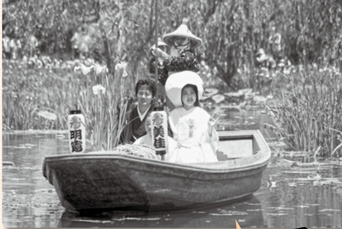
▲新郎新婦はサッパ舟で園内水路を周遊（6月7日撮影）