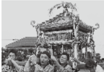
▲南小川の妙剣神社(7月25日)