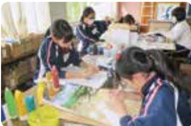
▲ポスター制作風景

こんにちは。小見川中学校美術部は男子5名、女子32名で活動しています。活動内容はポスターコンクールへの出品、校内への作品展示、年に数回の街のボランティア活動への参加です。学年も男女も超えてみんな仲良く、笑顔あふれる私たちです。