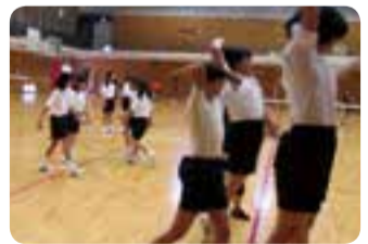
▲上級生が1年生に指導

スローガン「元気な声と笑顔」を掲げ、日々目標をもって活動しています。昨年度の県新人大会、県1年生大会、今年度の県選手権大会の経験を生かし、県総合体育大会での優勝、関東大会千葉への出場を目指し、現在、1年生16名の入部により総勢27名、パワーアップした声と笑顔で活動中です。