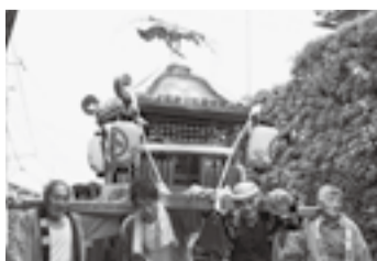
▲上小川の皇産靈神社(7月25日)