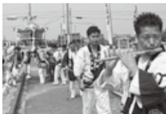
▲川上の須賀神社(7月11日)