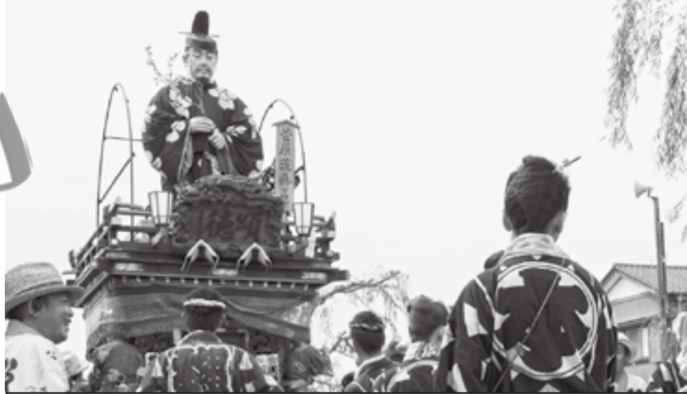
本宿・八坂神社の祇園祭。勇壮な山車が佐原に「粹」運びます

今年3年に一度の本祭 山車10台が整列し巡行 11日(土)の9時に山車10台が船戸川岸通りに整列し、小野川沿いなどを練り歩きます。また、17時には年番引継ぎ行事のため、忠敬橋を先頭に香取街道に山車が整列します。 各種物産販売広場を特設 飲食物の販売や他市町からの実演、販売コーナーなど ◇わくわく広場 ◇ふるさとお土産テント村 ◇にぎわい広場小江戸茶屋