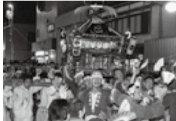
▲大根塚の金比羅神社(7月18日)