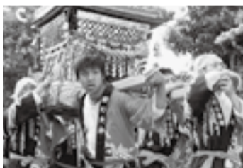
▲高野の駒形神社(7月19日)