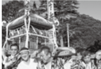
▲原宿の八坂大神(7月18日)