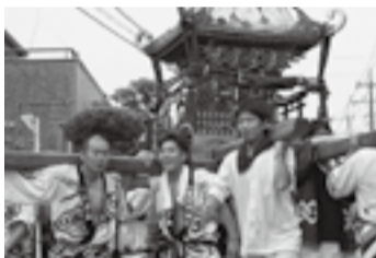
▲小見の琴平神社(7月11日)