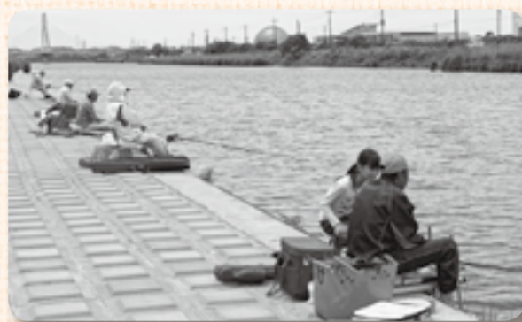
▲待望のアタリをじっと待つ

釣りが盛んな香取市で5月の風物詩となっているふな釣り大会が、5月10日に横利根川と長島川で、5月24日には黒部川で行われました。両大会ともに天候に恵まれ、市内外から、約150人の腕自慢が集まり、釣果を競い合いました。