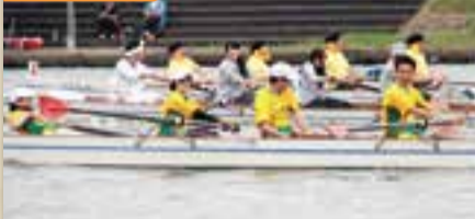
香取市民レガッタ