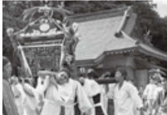
▲新里の八重垣神社(7月18日)