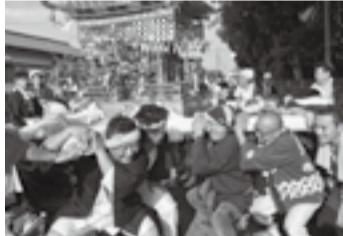
▲阿玉川の八坂神社(7月11日)