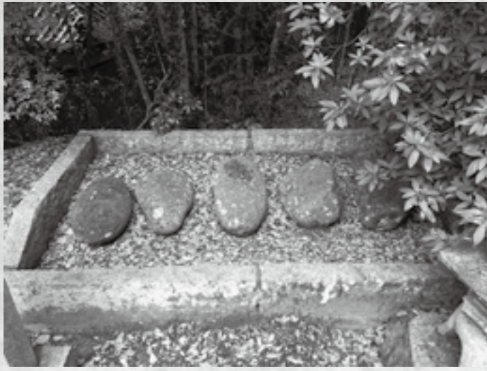
▲玉田神社の力石5個

玉田神社は、大倉丁子に鎮座しています。祭神は、五穀と食物をつかさどる倉稲魂神で、この神は、『日本書紀』には伊弉諾尊と伊弉冉尊の子とあり、『古事記』では須佐之男命と神大市比売の子と記されています。