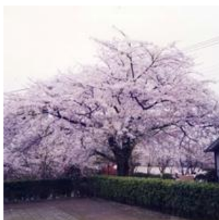
ソメイヨシノ(城山公園)