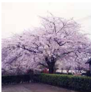
ソメイヨシノ(城山公園)