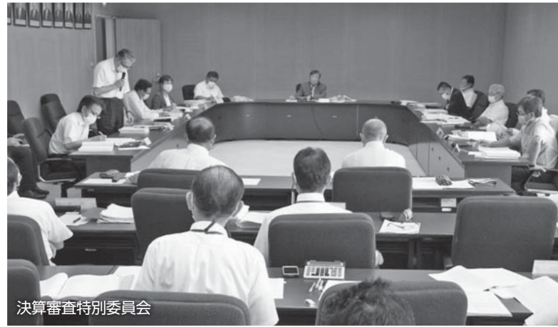
決算審査特別委員会

市長は、監査委員がチェックした前年度決算について、議会の審査を受け、期日までに議会の認定を受けなければなりません。審査の結果、全ての決算が認定されました。