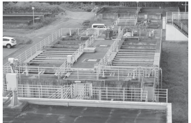
運転監視や維持管理を委託している玉造浄水場

A 浄水施設運転監視および維持管理業務委託で、アイテック株式会社千葉支店に委託している費用が主なものです。玉造浄水場は12人、城山浄水場は9人、合わせて21人の体制で24時間勤務です。