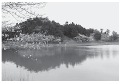
自然体験エリアとしての活用が期待される牧野の森

A 香取市活性化計画のほか、農村滞在型機能整備計画を策定し、農林業体験による都市住民との交流促進施設の一つに位置付け、散策路等を整備しています。桜の里