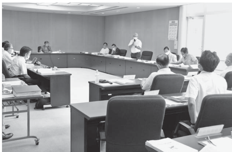
認定第1号一般会計歳入歳出決算に対する反対討論