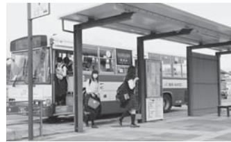
幅広い世代の交通手段として活躍する路線バス

Q 路線バスと乗合タクシーの運行経費の赤字補てん額と受益者負担率は、また、見直しは必要か。