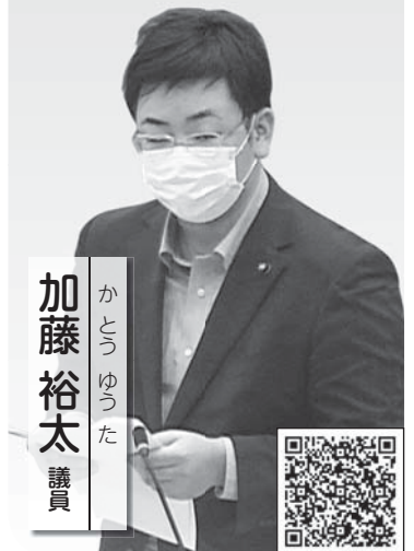
かとう ゆうた 加藤 裕太 議員