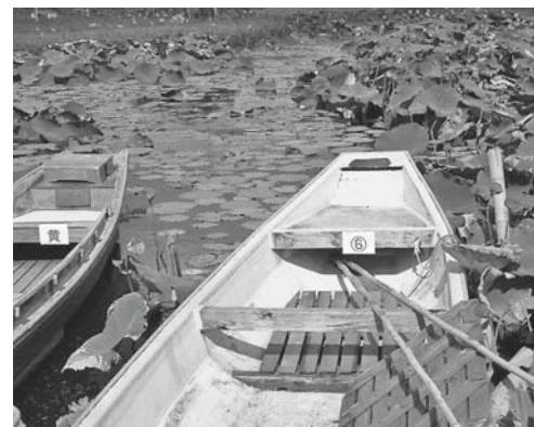
遊覧船の座席改修で密を避ける

A 感染予防対策に資する環境整備のうち、管理運営に係るものを指定管理者に委託するものです。具体的には、休憩所の増設や園内遊覧船の座席の改修等で密を回避する対策のほか、園内案内板の増設などとなります。