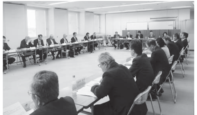
市の農業振興のために活動する委員43人

A 活動実績と成果実績を基準に農業委員および農地利用最適化推進委員に交付しています。活動実績分は207万3千円、成果実績分は、委員一人あたりの基本額が1万4千円で、委員全員分で722万4千円となり、合算すると929万7千円です。