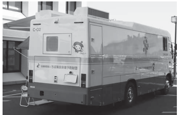
定期的ながん検診で早期発見・早期治療

A 胃がん検診が10.1%、大腸がん検診が19.8%、肺がん検診が19.5%、前立腺がん検診が34.2%、乳がん検診は2種類あり、エコーが73.6%、マンモグラフィが33.1%、子宮がん検診が23.4%となっており、全体では21.5%の受診率です。