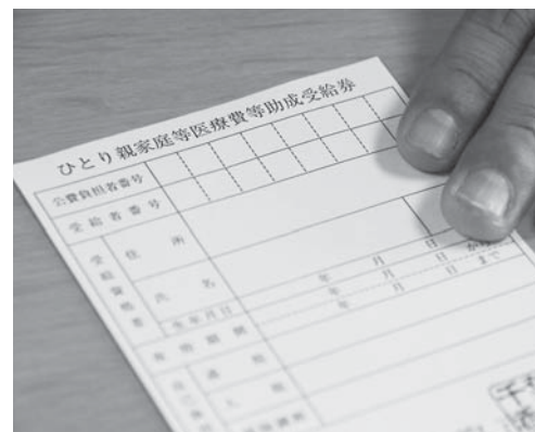
ひとり親家庭等医療費等助成受給券で 支払いが便利に

A 受給券の発行と医療費の支払い方法が同じになりますが、ひとり親家庭等の医療費は、子どもだけでなく保護者も対象となります。9月1日現在、保護者が480人、子どもが697人、合計1,177人を見込んでいます。