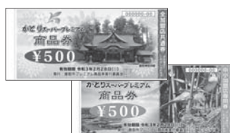
新型コロナウイルス感染症支援策かとりスーパープレミアム商品券

A 佐原商工会議所、香取市商工会、佐原商店会連合会、小見川商店会連合会、くすター商業協同組合および市です。