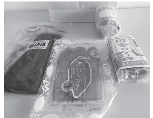
香取の特産品で宿泊客をおもてなし

A 新型コロナウイルス感染症の影響で落ち込んだ観光需要を回復するため、県のウエルカム・トゥ・千葉観光キャンペーン事業を活用し、地域特産品を宿泊客に提供するなど、再訪や特産品の購買を促進する取り組みを支援します。