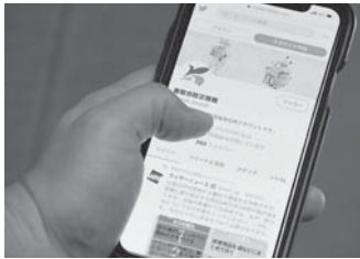
8月から運用が開始した 防災情報ツイッター

所の情報、ライフライン等の情報を発信していきます。平常時には、防災啓発に重点を置いた内容を発信予定です。