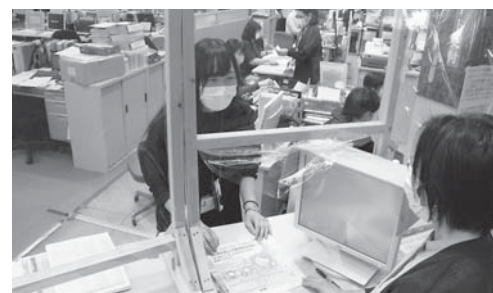
マイナポイント等の特典で マイナンバーカード取得が進む

A 平成27年度の制度開始から令和2年度の通知カードの廃止まで、合計2,182件です。