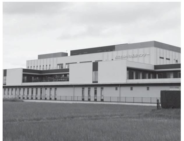
地域医療を支える香取おみがわ医療センター

A 入院延患者数は1万7,890人、1日平均患者数は84人です。前年の同時期と比較し減っていますが、稼働病床数が150床から100床に減床した影響と思われます。また、外来延患者数は5万8,881人、1日平均患者数は429.8人です。入院患者数と同様に前年の同時期と比較し患者数が減っていますが、新型コロナウイルス感染症に対する警戒感の影響と思われます。