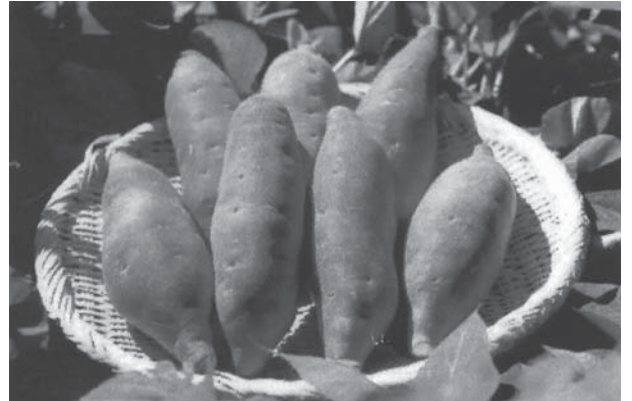
返礼品として人気の特産品サツマイモ

A 9,464件で、このうち474件は、台風15号および19号の災害復旧支援として返礼品なしの寄附です。令和元年度の寄附額は1億2,935万4,697円で、このうち災害復旧支援分は1,286万9,697円。平成30年度が8,301万円で、4,634万4,697円の増加となりました。