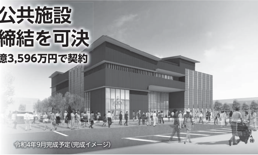
令和4年9月完成予定(完成イメージ)

落札価格総額のうち、15年間の維持管理・運営契約分を除く、施設整備分34億3,596万円をグループの代表企業である清水建設株式会社千葉支店と工事請負契約を締結するための議決をもとめる議案が上程され、付託された総務企画常任委員会で審査したところ、賛成多数で原案可決、本会議の採決でも賛成多数で可決しました。