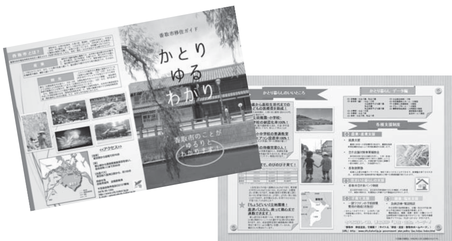
香取市の魅力が詰まった移住ガイド

A 主に3つの要因が考えられます。1つ目は、事業手法にDBO方式を採用したこと。DBO方式は事業者が自身のノウハウを最大限に活用できる方式で、その結果コスト削減につながったと考えます。2つ目は、複数の事業者が入札に参加したこと。価格競争が生まれたことです。競争性を確保するために、事業者の最も参画しやすいSPCを組成しないDBO方式を事業手法として選択した結果です。3つ目は、建設市況が下降局面に入ったため、建設コストも想定を超える下落幅となったことです。加えて、新型コロナウイルス感染症拡大による社会経済活動の変化も建設市況下降の要因の一つと考えます。