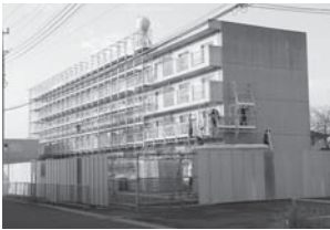
より快適な住環境へ大規模改修工事が進む市営住宅粉名口団地

A 県内23の市町村が保証人規定を継続していますので、他の自治体の取り組みを参考にしながら検討していきます。