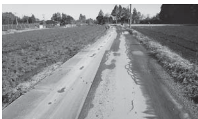
早期の復旧が求められている市道Ⅱ-9号線