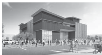
佐原駅周辺地区複合公共施設 完成イメージ

A 1階に千葉銀行とカフェ、3階に社会福祉協議会が入居予定です。利用時間は、図書館と子育て世代支援施設が午前9時から午後7時まで、公民館が午前9時から午後10時まで、観光情報発信施設が午前9時から午後5時までです。テナントは入居する事業者の運営時間によります。