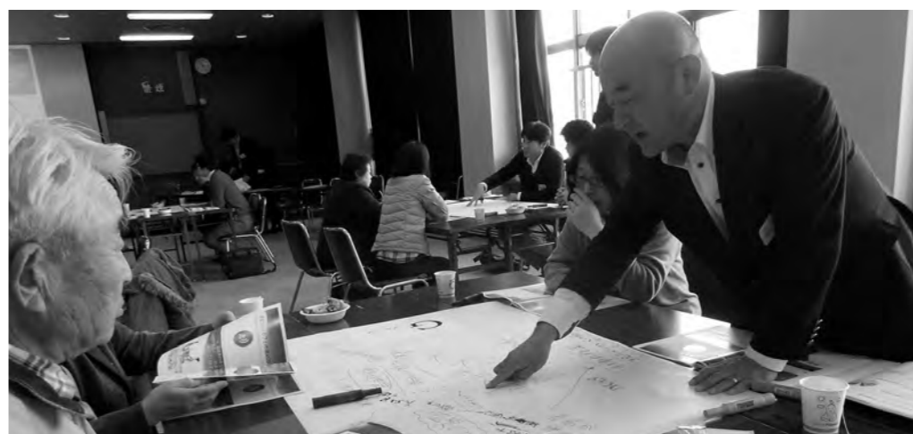
市民懇談会（ワールドカフェ）で香取市の未来を考える