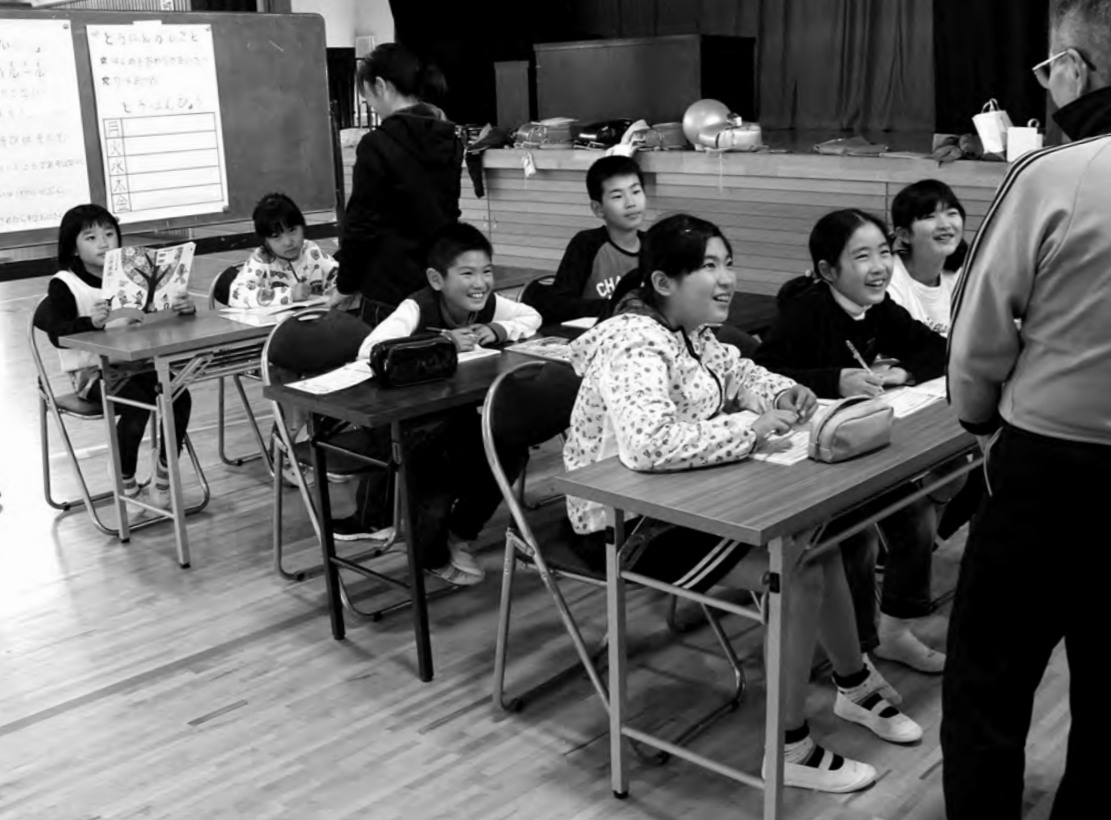
みんなでやれば宿題も楽しい!津宮小学校の放課後こども教室