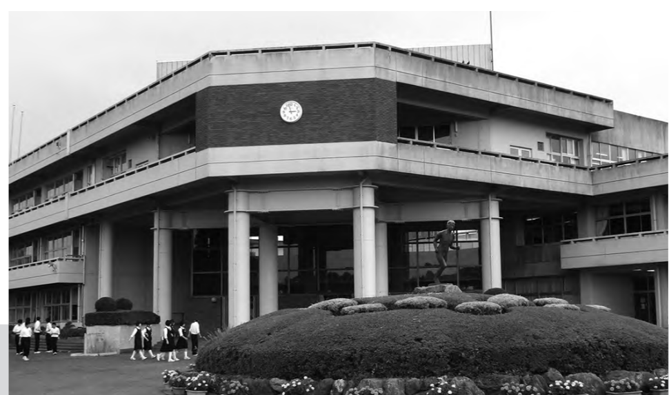
大規模改修が予定されている山田中学校