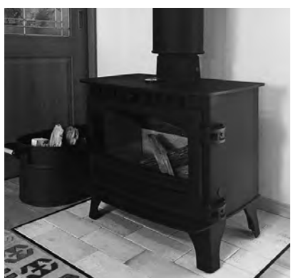
薪ストーブは家族団らんにも

A 地方創生推進交付金活用事業で、薪需要の創出による低炭素社会を目指す実証事業です。薪ストーブ等の設置促進のため、使用方法の講習会や、モニター制度を計画しています。