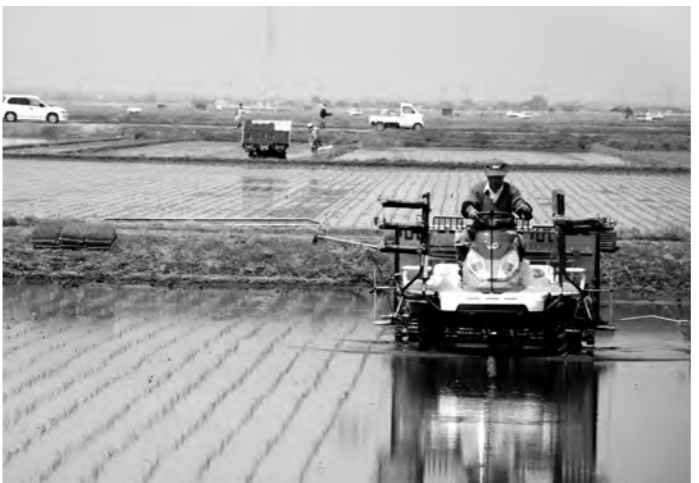
香取市は関東一の米どころ

ていますが、二重投票を防止する選挙人名簿対照を携帯電話で行うなど、対象となる有権者数が極めて少ないため可能と思われる。市では同様の投票所の有権者数が、浜田市に比べ格段に多く、環境が異なるため、車による移動期日前投票所の導入は、困難なものと認識しています。