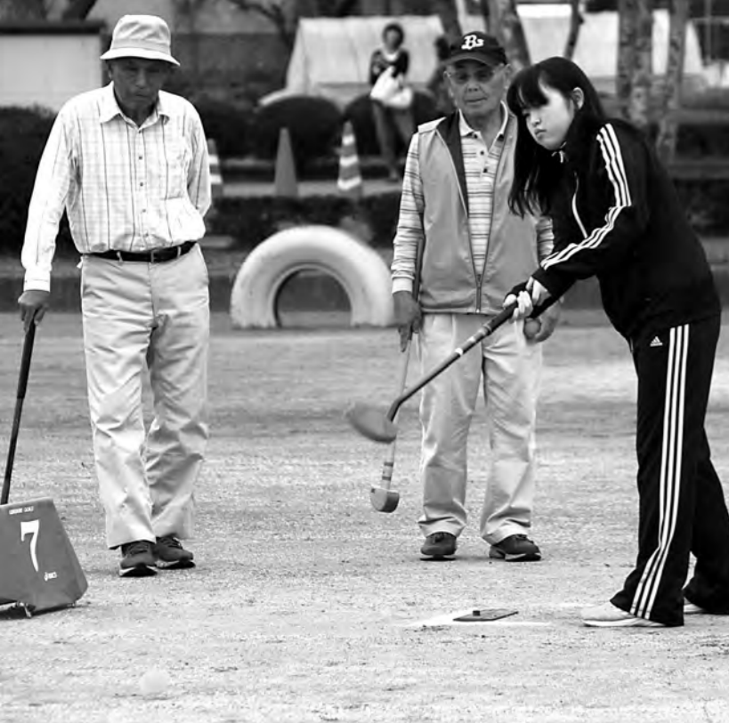
世代を問わず楽しめるグラウンドゴルフ