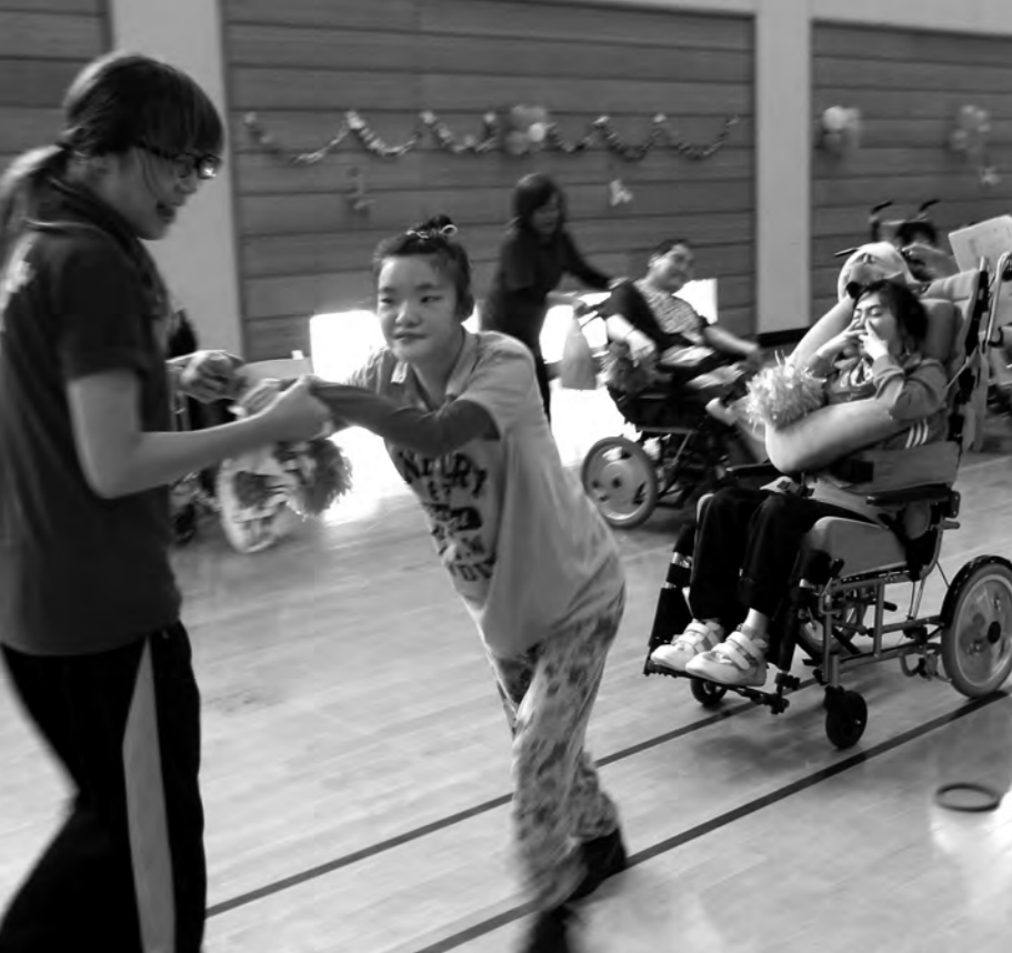
障がい児者の地域生活支援の拠点である高萩福祉センターへ生まれ変わった旧高萩小学校

3月定例会では、3月6日(月)・7日(火)に、8人の議員が一般質問を行いました。ここでは、一般質問の内容を要約して掲載しています。