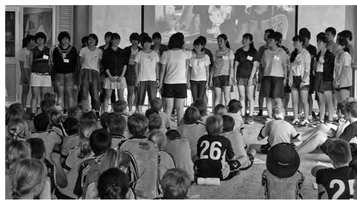
オーストラリアのブルーンベル・ステイト校との交流会

A 平成28年度は、市内中学校2年生を対象に、オーストラリア方面へ、異文化理解やホームステイの体験をするために34人の生徒を派遣しました。平成29年度は、研