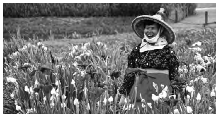
平成29年4月29日にプレオープンした水郷佐原あやめパーク

A 通年型の施設として、ハナシヨウブはもちろんのこと、ハナシヨウブの時期以外にも、藤とハスのアピールや、山野草の展示、草木染の体験等を実施し、施設の有効活用と観光客の増加を図っていきます。また、旅行会社を通してツアーを誘致することで、平成29年度は平成28年度の1.5倍およそ9万5千人の入園者数を見込んでいます。