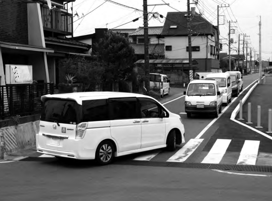
オーバーランでどうにか左折可能に（おみがわこども園脇）