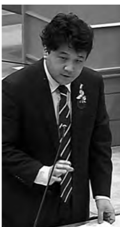
いとう ともり 伊藤 友則議員

Q 障がい者は、知的・身体・精神に大別される。身体障がいは、視覚・聴覚等に分けられ国民の6〜7%に何らかの障がいがあるという報告もある。スポーツ基本法の制定、障害者基本法の改訂がなされ、障がい者の自立・社会参加、共生社会の実現を図る