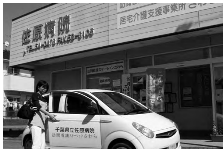
在宅医療の重要拠点である県立佐原病院の訪問看護ステーション

議で記載がない申告書も相談・受付をすることとされ、市の申告相談も同様の対応をしています。個人住民税の特別徴収税額決定通知書については、地方税法施行規則の一部改正でマイナンバーの記載欄が設けられましたが、漏洩のリスク増加が懸念されることから、市でも実務上の取り扱いを調査研究しています。