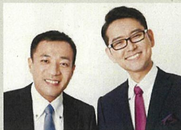
ナイツ(お笑い芸人)

当日は日本遺産の構成文化財である「石見神楽」の実演や、お笑い芸人ナイツをはじめとする著名人らのスペシャルトークを予定しています。