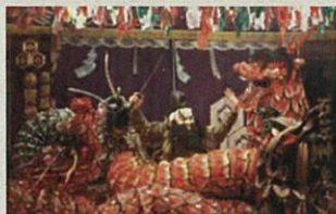
島根県 / 石見神楽