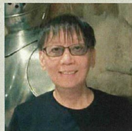
堀井 雄二(ゲームデザイナー)