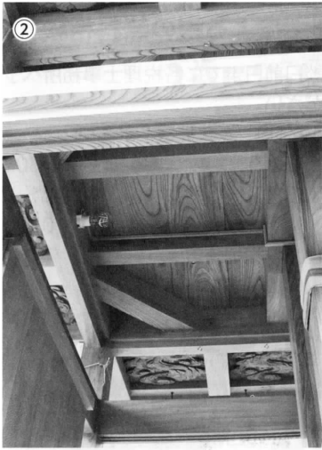
①彫物を付けずに木目を披露しての曳き廻し ②美しい木目の中天井 斜めの補強材が見える

平成30年5月3日、荒久区山車新造竣工式が執り行われました。新しい山車には、大天井に五色の幡、左右に鶴と亀を飾り、四方には玄武、青龍、朱雀、白虎の四神を配しています。祭礼時とは異なったあつらえです。山車の前には、祭壇が設けられ、八坂神社宮司による祝詞奏上や参列者による榊奉納などが厳かに執り行われました。式の後、野田芸座連が祝砂切を演奏し、お披露目の曳き廻しへと出発しました。荒久区の旧山車は、昭和3年の建造で、約90年が経ちます。長年の使用により、部材のひび割れや変形が激しくなり、山車行事の伝承に支障をきたすと考えられました。そこで、町内では山車新造について議論がなされました。国の重要無形民俗文化財である「佐原の山車行事」は、重要な用具である山車本体をはじめ、大形や天幕、彫刻などの懸装品の保存・修理について、学識経験者からなる佐原山車行事伝承保存会評議委員会に諮問をし、文化財としてふさわしい計画となるよう審議が行われます。